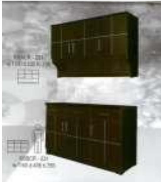
Sumber: PT LePrim Globalindo Utama

Struktur produk merupakan aktifitas pada sumber yang dibutuhkan untuk membuat produk akhir dan menggambarkan bagaimana produk itu dibuat. Pembuatan struktur produk diturunkan dari bill of material . Dapat kita lihat produk kitchen set pada gambar 1 berikut.