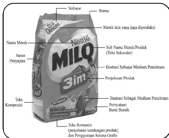
Gb.2. Penerapan Elemen-Elemen Visual Pada PDU Kemasan Susu Milo

Elemen-elemen pada PDU yang diperlukan pada umumnya (elemen primer) meliputi: tanda merek, nama merek, nama produk, keterangan komposisi, ( ingredient ), berat bersih, informasi nilai gizi, tanggal kadaluarsa, peringatan bahaya, arahan penggunaan, dosis, intruksi, ragam, barcode. Sedangkan elemen yang diatur dengan desain (elemen sekunder) meliputi : warna, citra, huruf, ilustrasi, sarana grafis, foto (non informasi), simbol (non informasi), ikon, hirarki visual (Klimchuck dan Krasovec, 2007:84,85).