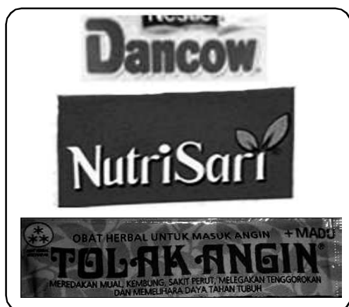
Gb.3. Logo berupa Lettermark sebagai Identitas Merek Berfungsi untuk Mengkomunikasikan Kepribadian Produk

representasikan kepribadian merek. Gaya tipe huruf mengkomunikasikan karakteristik yang berbeda dan pilihan tipografi harus mengkomunikasikan kepribadian merek, unik, serta mudah diterapkan dan dapat dibaca dalam ukuran, format, warna dan pilihan cetakan yang berbeda (Klimchuck dan Krasovec,2007:196). Pilihan, aplikasi tipografi dan elemen grafis terdiri dari simbol, ikon, warna, ilustrasi, dan elemen estetis diciptakan untuk memenuhi tujuan agar sebuah desain sesuai, dapat dikenali, dan unik bagi merek. Proses pengembangan identitas merek bisa memuaskan jika pilihan tipe huruf dan modifikasi desain dapat memberi solusi tujuan komunikasi. Nama merek/ produk pada panel display utama umumnya berbentuk lettermark , berupa tulisan yang diidentikkan dengan produk. Sebagai contoh Tolak Angin, diidentikkan dengan produk jamu herbal yang berkasiat untuk menyembuhkan masuk angin. Contoh lain, Nutri Sari sebagai produk minuman yang berasal dari sari buah berkualitas, Dancow sebagai merek susu sapi bubuk yang dikemas secara higienis. Untuk mencapai kesuksesan dalam mengkomunikasikan kepribadian produk, diperlukan strategi dalam memilih jenis huruf yang akan digunakan, skala, penempatan posisi, layout, warna, dan desain.