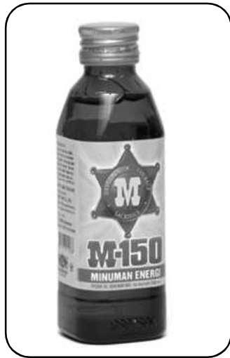
Gb.4. Bentuk Kemasan Sebagai Strategi Komunikasi Produk