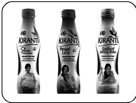
Gb.5. Bentuk Kemasan Sebagai Strategi Komunikasi Produk