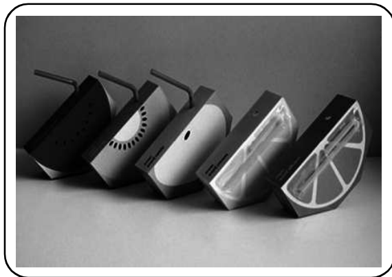
Gb.6. Bentuk Kemasan Sebagai Strategi Komunikasi Produk