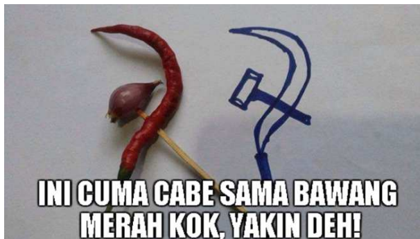
Gambar 1. Bawang dan Cabe

Sugandhi agar jangan mengidap fobia komunis karena terdapat tuduhan mengenai keterlibatan Aidit dalam kejadian itu (van Der Kroef 1972). Dekade-dekade fobia komunis terjadi selama Orde Baru berkuasa (1967-1998) yang mengakibatkan bangsa Indonesia begitu mengalami defisiensi dan distorsi pandangan tentang kalangan aktivis komunis dalam sejarahnya (Chandra 2013). Begitulah, apa pun yang dianggap komunis dan siapa pun yang dituding telah menyebarkan komunisme dengan begitu saja sampai tandas dihancurkan.