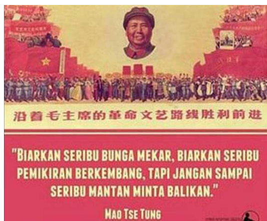
Gambar 5. Meme Mao Tse Tung

Desember 2016). Secara keseluruhan lirik lagu itu berkisah tentang seseorang yang dikhianati kekasih yang amat disayanginya. Tentu saja, semua penjelasan mengenai Tan Malaka yang gigih dengan perjuangannya, reputasinya yang tidak tertandingkan, dan visinya mengenai kemerdekaan Indonesia yang harus mencapai 100 persen, hanya dibuyarkan begitu saja oleh sekeping meme comics dan hanya menjadi “butiran debu”.