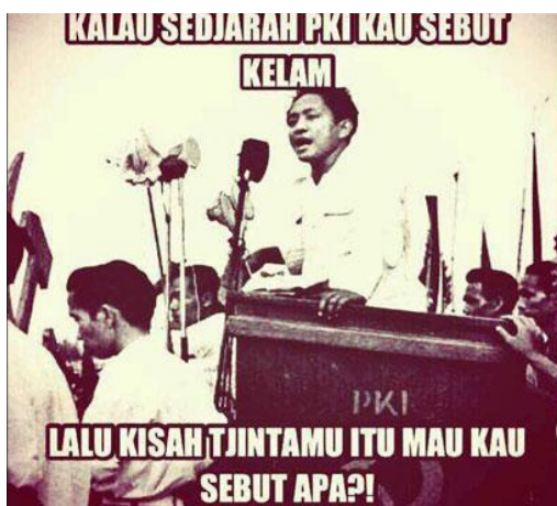
Gambar 3. Meme Aidit

PKI identik dengan Dipa Nusantara Aidit. Nama inilah yang dianggap sebagai biang permasalahan bangsa sejak 1965, selama rezim Orde Baru berkuasa, bahkan hingga saat ini. Apabila nama Aidit disebutkan, maka serentak dengan itu hantu yang bernama komunisme bergentayangan. Aidit adalah sosok yang demikian menakutkan. Ketika ada lukisan dari beberapa tokoh nasional dan salah seorang di antara mereka mirip—atau diduga adalah—Aidit di Bandara Soekarno-Hatta, maka kehebohan pun lekas menyeruak. Pihak pemegang otoritas bandara telah menegaskan bahwa berbagai lukisan itu ingin memperlihatkan kaleidoskop bangsa ini yang terdiri dari tokoh yang memiliki ideologi-ideologi yang berbeda. Ada tokoh yang dianggap membawa sejarah baik dan terdapat pula tokoh yang membawa sejarah kelam ( Kompas.com edisi Jumat, 12 Agustus 2016, 14:38 WIB). Pernyataan itu secara implisit menunjukkan bahwa lukisan itu memang figur D.N. Aidit yang telah membawa sejarah kelam bagi bangsa ini. Kekelaman Aidit, dan PKI, adalah hasil dari konstruksi ideologi Orde Baru.