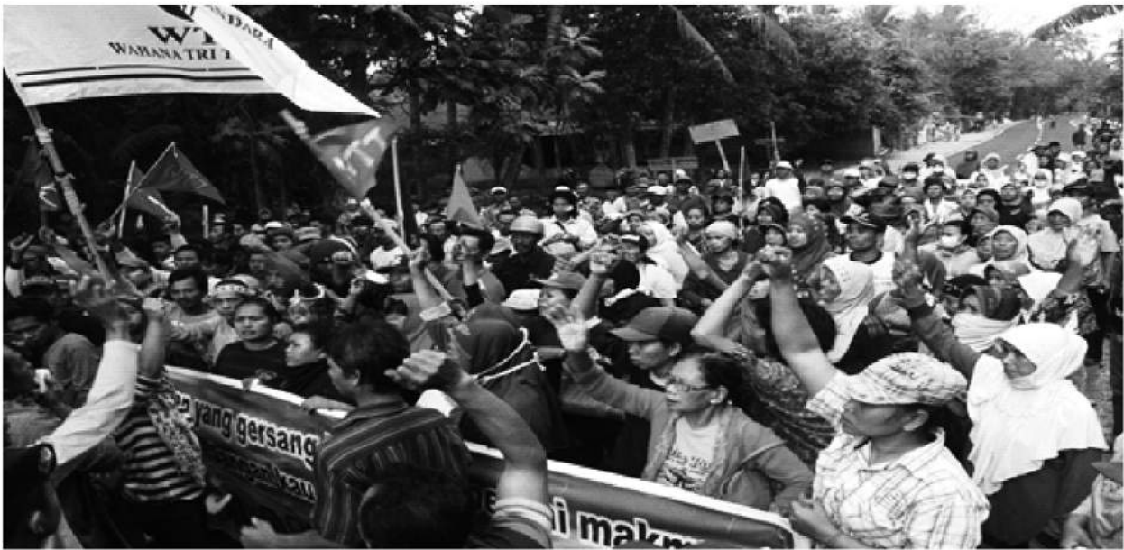
Gambar 3. Warga Sedang Melakukan Aksi Demonstrasi

Warga memasang spanduk, papan, dan tampah yang beruliskan ancaman dan kritikan-kritikan yang ditujukan kepada Pemkab Kulon Progo dan PT. Angkasa Pura I (Persero) di sepanjang Jalan Glagah Kecamatan Temon.