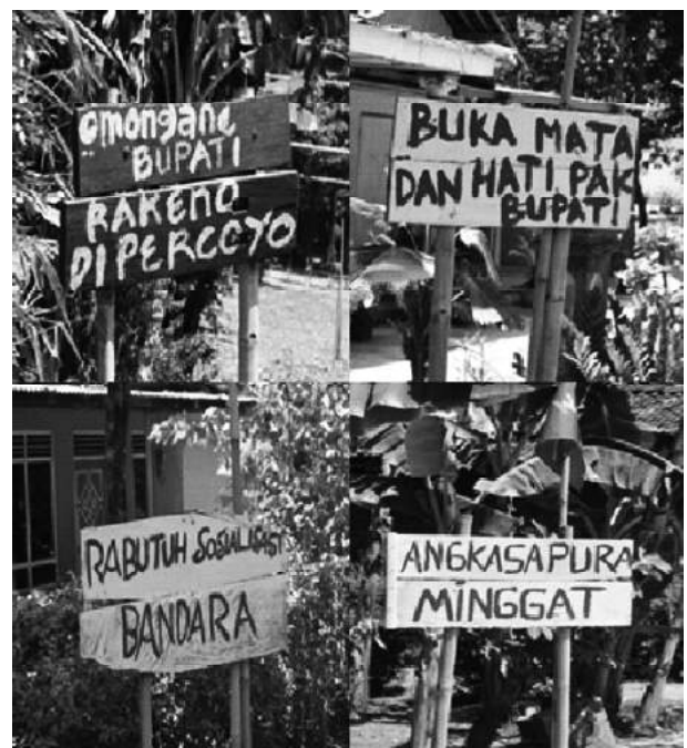
Gambar 2. Bentuk Penolakan Warga

montrasi menuntut pemerintah untuk membatalkan rencana pembangunan Bandara yang akan dibangun di wilayah Kecamatan Temon tersebut.