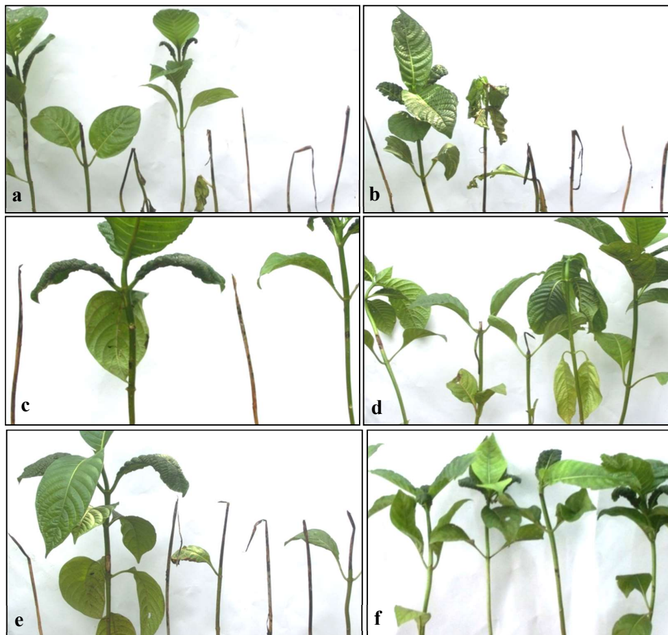
Gambar (Figure) 2. Gejala mati pucuk pada bibit jabon setelah diinokulasi lima isolat Botryodiplodia spp.: a) isolat Botryodiplodia sp. 1, b) isolat Botryodiplodia sp. 2, c) isolat Botryodiplodia sp. 4, d) isolat Botryodiplodia sp. 5, e) isolat Botryodiplodia sp. 3, dan f) kontrol ( dieback symptoms on jabon seedlings after inoculation of five Botryodiplodia spp. isolates: a) Botryodiplodia sp. 1 isolate, b) Botryodiplodia sp. 2 isolate, c) Botryodiplodia sp. 4 isolate, d) Botryodiplodia sp. 5 isolate, e) Botryodiplodia sp. 3 isolate, and f) control )

yang dihasilkan oleh ke-5 isolat Botryodiplodia spp. cukup beragam. Persentase kejadian penyakit paling tinggi dihasilkan isolat Botryodiplodia sp. 1 dan Botryodiplodia sp. 3 (90%), kemudian diikuti isolat Botryodiplodia sp. 2 (70,67%), isolat Botryodiplodia sp. 5 (32,31%), dan Botryodiplodia sp. 4 (26,57%), sedangkan kontrol tidak memperlihatkan adanya gejala (0%) (Tabel 2).