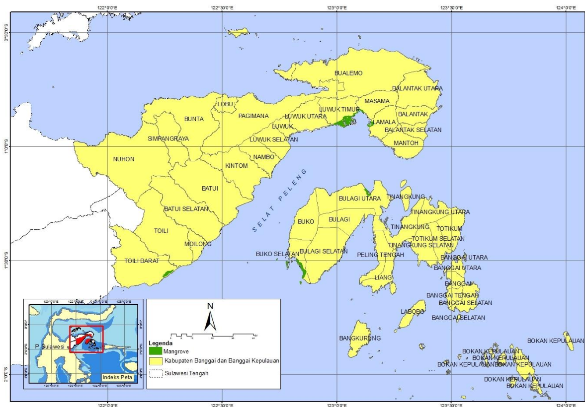
Gambar 1. Sebaran mangrove di lokasi penelitian.

Data sosial ekonomi diperoleh dengan metode deep interview dan kuisiонер dengan mengambil sample representative (20 % dari jumlah penduduk yang tinggal disekitar hutan mangrove). Masyarakat yang dijadikan responden meliputi nelayan, pencari kayu bakar, dan juga pada masyarakat yang berhubungan dengan mangrove secara tidak langsung.