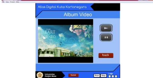
Gambar 4.4. Halaman info lain (Pariwisata dan video)