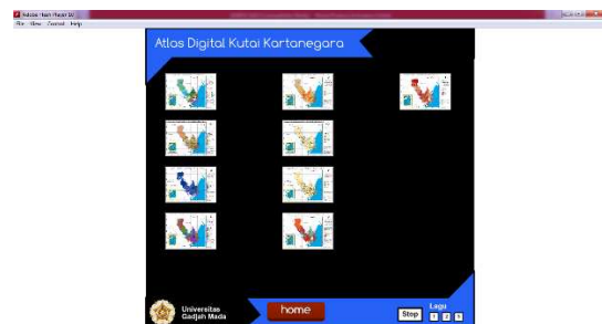
Gambar 4.9. Fasilitas print out