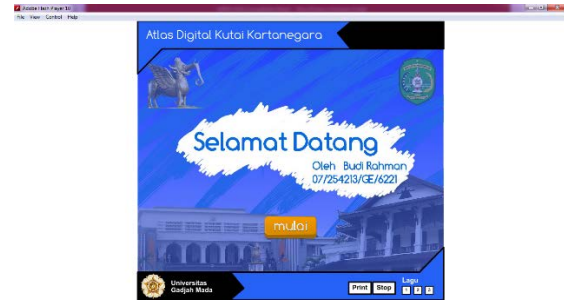
Gambar 4.1. Halaman muka ( home ) aplikasi start

Visualisasi informasi pada layar monitor juga harus dirancang dan diatur seperti halnya pada disain dan konstruksi peta. Model visualisasi yang interaktif dan informatif sehingga rmemudahkan pengguna memahami struktur e-atlas dan potensi kreatif visualisasi. Model visualisasi atlas pada e-atlas terdiri atas beberapa halaman tampilan yang dikelompokkan menjadi 5 yaitu halaman muka (home), halaman info umum, halaman info lain, halaman karakter fisik dan halaman karakter sosial ekonomi budaya.