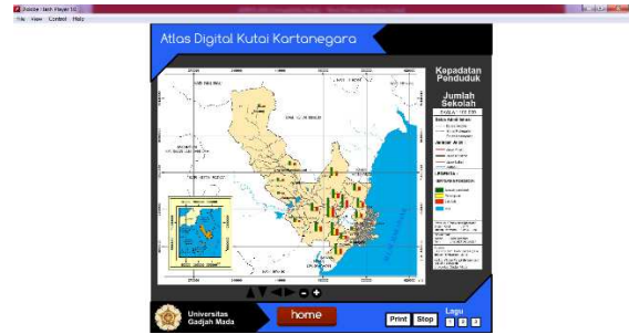
Gambar 4.7. Halaman Sosek