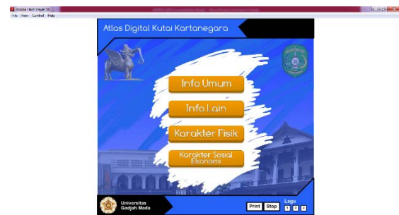
Gambar 4.2. Halaman muka ( home )