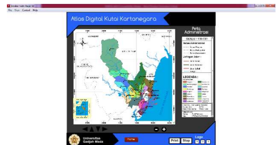
Gambar 4.3. Halaman info umum