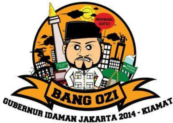
Gambar 9 Gambar profil akun Twitter @FahruroziIshaq

Selain di Facebook , kritik terhadap tokoh agama juga dilancarkan di Twitter . Salah satu akun parodi yang cukup banyak memiliki pengikut adalah akun @FahruroziIshaq. Fahrurozi Ishaq adalah Gubernur DKI Jakarta tandingan yang dilantik oleh FPI pada 8 Desember 2014 silam.