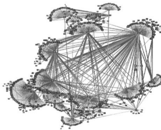
Gambar 1 Gambar Jaringan yang Menghubungkan Dunia Kecil ( Cluster )

Situasi yang demikian menunjukkan pergeseran relasi kekuasaan dapat terjadi. Connel (2010: 6) menyebutkan bahwa hal tersebut terkondisikan oleh kesadaran keanggotaan kelas dan kesempatan untuk melakukan class action yang dibangun oleh para anggota kelas yang bangkit.