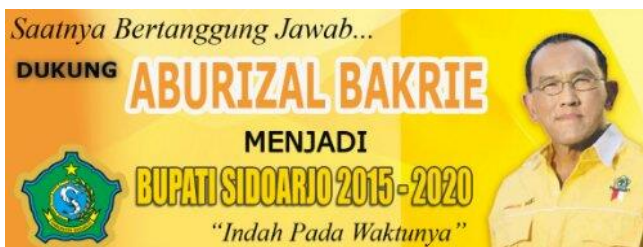
Gambar 6 Meme yang menyindir Aburizal Bakrie

Kritik para netizen terhadap pencalonan Aburizal Bakrie juga diperkuat secara ilmiah. Indo Barometer menyebutkan bahwa dari skala 1-10, integritas moral Aburizal Bakrie hanya di angka 6,0. Angka itu terendah dari beragam aspek lainnya yang dinilai dalam survei tersebut (Kompas, 2014). Reaksi publik di media baru terhadap aktivitas bidang ekonomi dan politik keluarga Bakrie diwujudkan dalam beberapa meme .