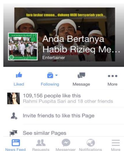
Gambar 8 Page parodi bertajuk Anda Bertanya Habib Rizieq Menjawab

Wawancara dengan kreator sekaligus administrasi page ABHRM, disebutkan bahwa motivasi pembuatan laman tersebut karena mudahnya masyarakat terprovokasi atau digiring opininya oleh argumen-argumen berbalut agama.