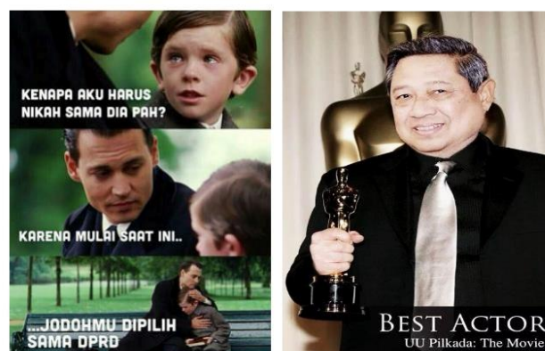
Gambar 3 Meme lucu untuk mengkritik elit politik yang mengesahkan RUU Pilkada.

Meme adalah sebuah gambar, video, dan sebagainya yang disebarakan secara elektronik dari satu pengguna internet ke pengguna lainnya. Penyebaran meme sangat cepat dilakukan melalui media sosial. Pada masa kekisruhan pengesahan RUU Pilkada tersebut, meme yang muncul tidak saja yang bersifat serius. Beberapa gambar diedit sedemikian rupa atau dilengkapi dengan kata-kata yang bernada satir namun masih terkesan lucu. Beberapa meme lucu namun kritis seperti gambar-gambar yang cukup populer berikut ini: