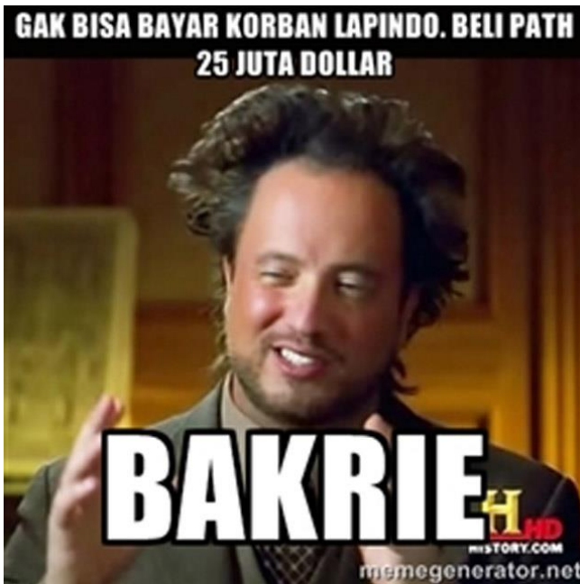
Gambar 5 Meme yang mengkritik pembelian Path oleh Bakrie Telecom

Terbengkalainya korban lumpur Lapindo kontras dengan sepak terjang Grup Bakrie dan pemiliknya, membuat masyarakat merasa gerah dengan sepak terjang pengusaha yang pernah menjadi orang terkaya di Indonesia tersebut. Selain di bidang ekonomi, aktivitas Aburizal Bakrie di bidang politik paradoks dengan kondisi korban lumpur Sidoarjo. Masuknya Aburizal Bakrie dalam bursa bakal calon presiden 2014 mendapat olok-olok dari para netizen.