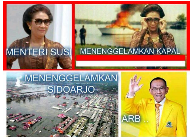
Gambar 7 Meme perbandingan kehebatan Menteri Susi Pudjiastuti dan Aburizal Bakrie

Perikanan, Susi Pudjiastuti, menenggelamkan kapal nelayan ilegal pada awal Desember 2014 silam. Dalam beberapa meme , digambarkan bahwa penenggelaman 3 kapal asal Vietnam tersebut belum apa-apa dibandingkan penenggelaman Sidoarjo.