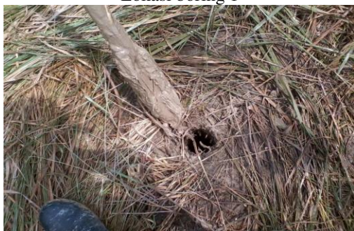
Lokasi boring 1