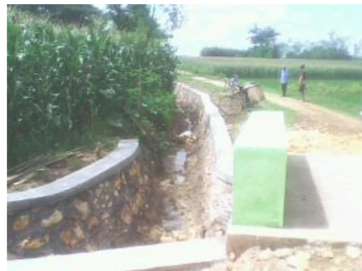
Gambar 2 : posisi jembatan

jembatan tersebut tidak terdani. Namun sesuai hasil kesepakatan MAD bahwa usulan tersebut menjadi skala prioritas usulan ditahun berikutnya atau terintegrasi dengan usulan Musrenbangcam yang akan dibawa oleh SKPD terkait. Dengan jeda waktu yang tidak lama 4 bulan ternyata ada program PNPM Paska Krisis di Kecamatan Tawangharjo sehingga usulan tersebut dapat terdani dengan dana Paska Krisis 2011.