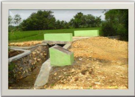
Gambar 4. Kondisi jembatan setelah dibangun

tanggal 28 Desember 2011. Dalam proses penyusunan desain tentunya perlu dipertimbangkan dan diantisipasi kondisi yang paling ekstrim yang bisa terjadi dan menimpa sebuah konstruksi. Demikian juga dalam pelaksanaan kegiatan perlu pengawasan dari fasilitator supaya pelaksanaan kegiatan sesuai ketentuan. Pengawasan dengan memberikan delegasi kepada masyarakat untuk bertanggung-jawab. Tentunya perlu ditingkatkan keberdayaan dan pemahaman azas PNPM-Mandiri Perdesaan yaitu Dari Oleh dan Untuk Masyarakat.