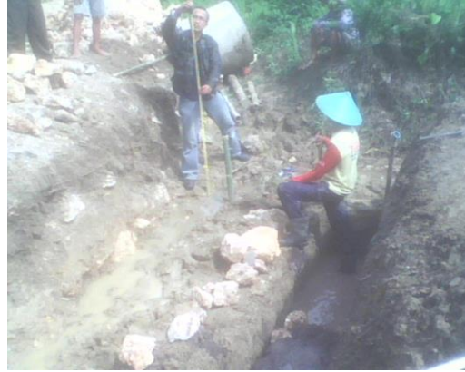
Gambar 3 : Pemasangan bouwplank

Akhirnya TPK sms ke Fasilitator untuk melaporkan kejadian yang ada jembatan tersebut. Akhirnya pada pagi itu juga Fasilitator turun kelapangan dan dilakukan pemotretan kondisi terakhir jembatan dan dibuatkan berita acara kejadian ambrolnya pondasi jembatan.