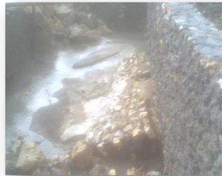
Gambar 2. Pondasi yang dibangun ambrol setelah terjadi penggerusan