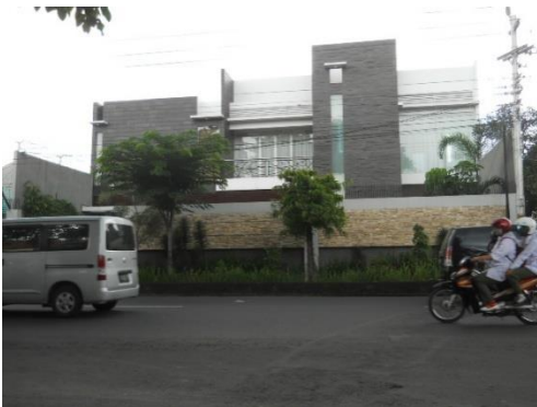
Gambar 12. Rumah minimalis kasus 5