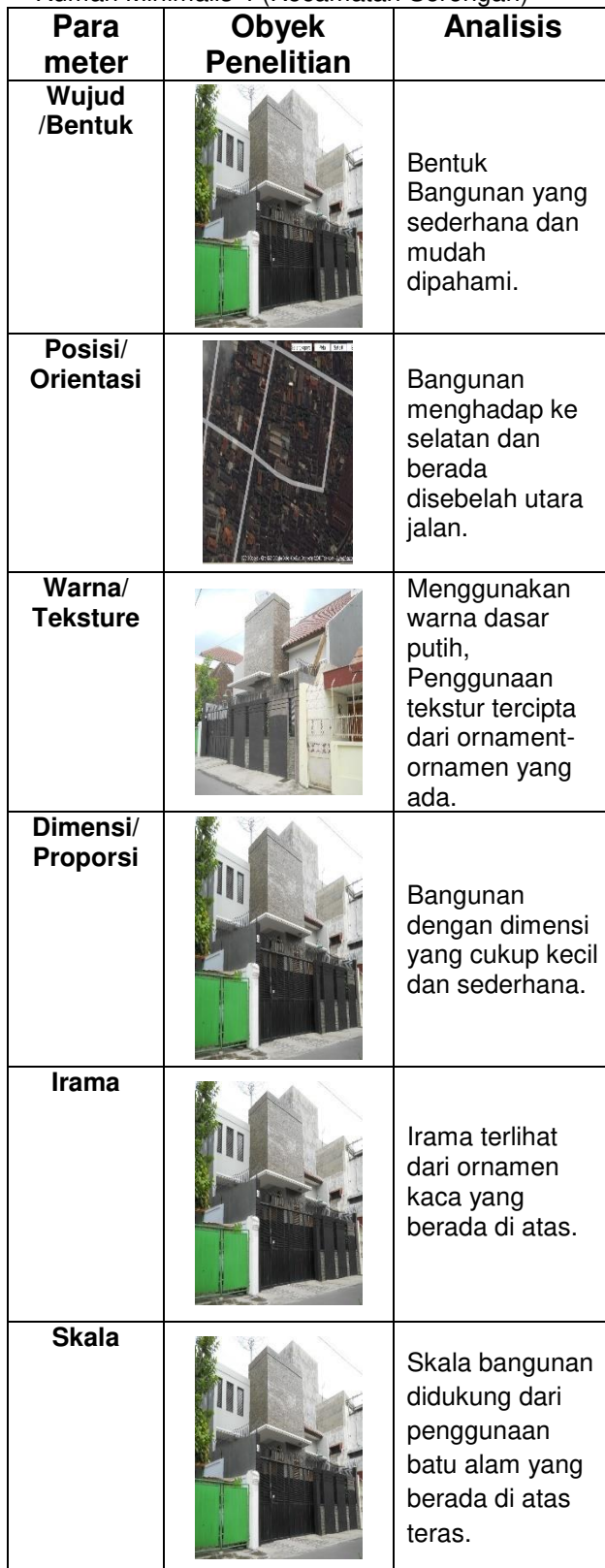
Tabel 4. Analisa Unsur-unsur Bentuk Bangunan Rumah Minimalis 4 (Kecamatan Serengan)