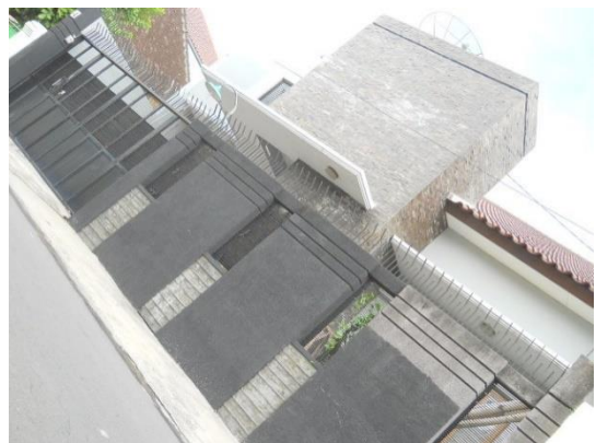
Gambar 10. Rumah minimalis kasus 4