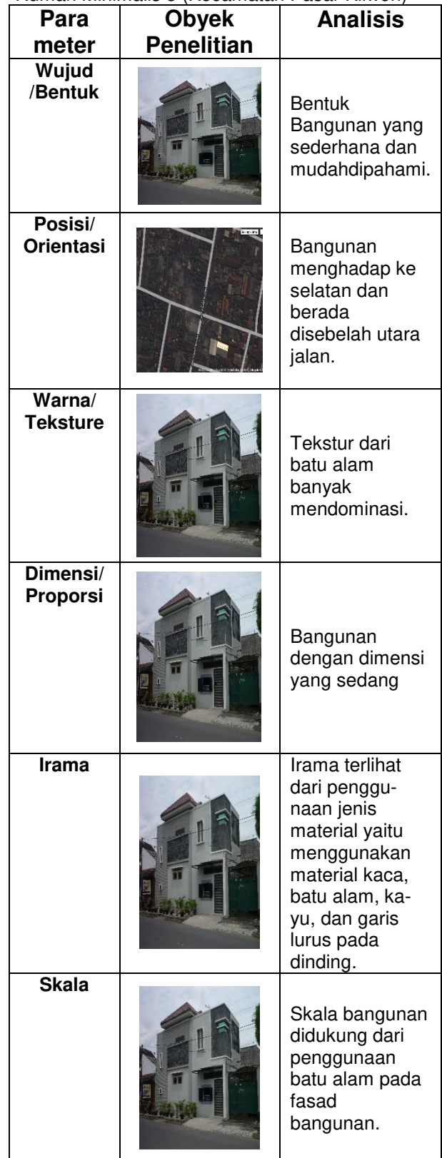
Tabel 3. Analisa Unsur-Unsur Bentuk Bangunan Rumah Minimalis 3 (Kecamatan Pasar Kliwon)