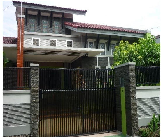
Gambar 5. Rumah minimalis kasus 2 Sumber : Dokumen pribadi, 2010

Rumah Minimalis dikecamatan Jebres ini merupakan rumah pribadi yang mempunyai gaya bercorak minimalis. Walaupun terdapat banyak ornamen pada rumah ini, bentuk fasad rumah tetap dikategorikan fasad minimalis.