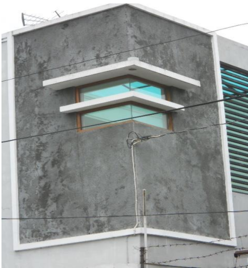
Gambar 8. Rumah minimalis kasus 3

Walau fasad ini hanya terdiri dari dinding bangunan yang berbentuk sebuah boks besar, namun tidak terkesan monoton dikarenakan ornamen yang ada pada dinding tersebut. Penggunaan batu alam dan permainan garis vertikal dan horizontal membuat fasad ini terlihat menarik.