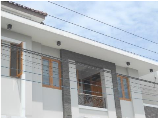
Gambar 4. Rumah minimalis kasus 1

Pemilihan warna pada dinding dan garis-garis pada dinding memberikan nuansa elegan pada desain rumah.