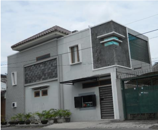
Gambar 7. Rumah minimalis kasus 3

Rumah minimalis dikecamatan Pasar Kliwon merupakan rumah pribadi yang mempunyai gaya arsitektur yang bercorak minimalis.