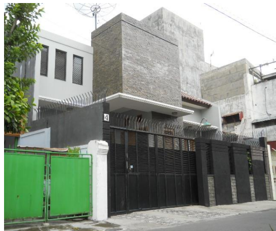
Gambar 9. Rumah minimalis kasus 4

Rumah minimalis dikecamatan Serengan ini merupakan rumah pribadi yang mempunyai gaya arsitektur yang mempunyai corak minimalis. Tidak banyak modifikasi yang dilakukan pada desain fasad di rumah ini. Penggunaan jendela-jendela kaca yang besar ditunjukkan sebagai sumber cahaya serta mengurangi kesan masif pada fasad. Pemilihan warna pada dinding yang manis memberikan nuansa elegan pada desain rumah, serta penggunaan material batu alam pada dinding teras juga mendukung kedinamisan fasad.