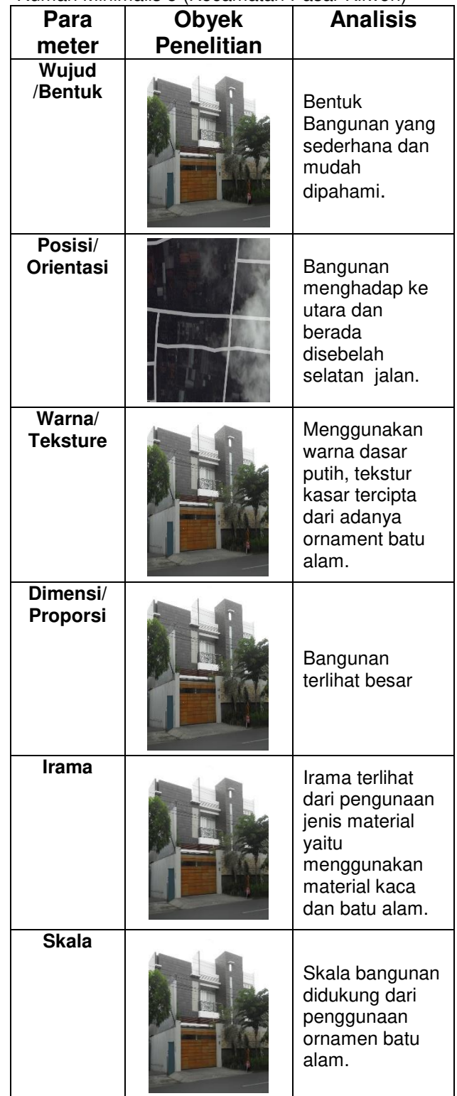
Tabel 5. Analisa Unsur-unsur Bentuk Bangunan Rumah Minimalis 5 (Kecamatan Pasar Kliwon)