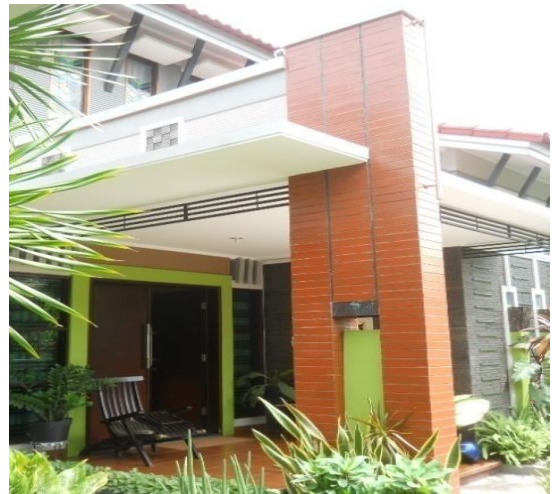
Gambar 6. Rumah minimalis kasus 2 Sumber : Dokumen pribadi, 2010

Ornamen lebih banyak terdapat pada dinding atau kolom. Ornamen pun bukanlah ornament yang sebenarnya, melainkan hanya sebagai salah satu variasi dari motif dinding. Penggunaan warna merah pada kolom penyangga teras ini menambah variasi warna pada fasad ini. Penggunaan material batu alam pada dinding yang menghadap taman menambah kesan alami.