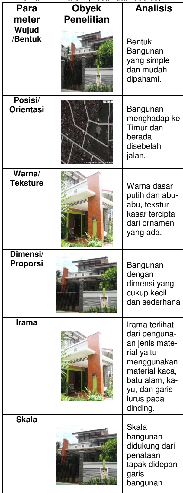
Tabel 2. Analisa Unsur-unsur Bentuk Bangunan Rumah Minimalis 2 (Kecamatan Jebres)