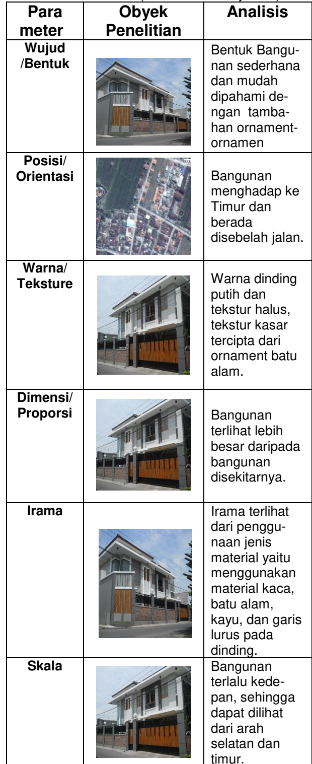
Tabel 1. Analisa Unsur-unsur Bentuk Bangunan Rumah Minimalis 1 (Kecamatan Banjarsari)