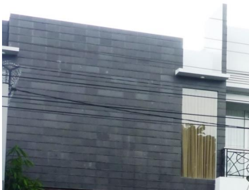
Gambar 13. Rumah minimalis kasus 5