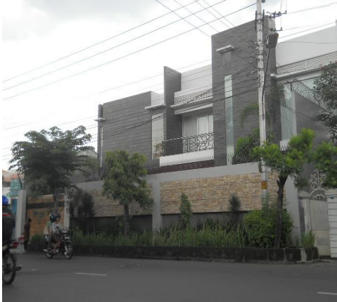
Gambar 11. Rumah minimalis kasus 5

Rumah Minimalis dikecamatan Laweyan merupakan rumah pribadi yang mempunyai gaya arsitektur yang bercorak minimalis. Adanya unsur batu alam dan material kaca yang besar dapat melunakkan kesan monoton yang terdapat pada fasad ini.