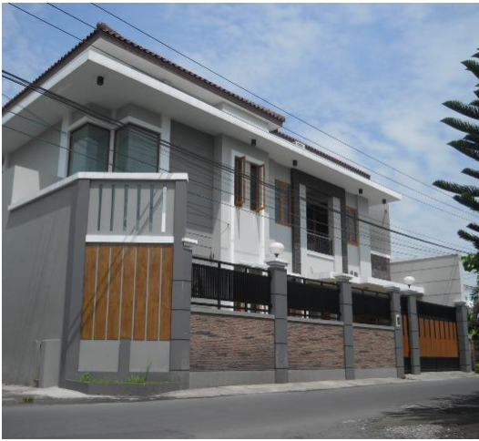
Gambar 3. Rumah minimalis kasus 1

Rumah Minimalis dikecamatan Bajarsari ini merupakan rumah pribadi yang mempunyai gaya arsitektur yang bercorak minimalis. Dengan menggunakan material alam seperti batu candi dan warna-warna natural, fasad rumah ini terkesan lebih alami dan tidak terlalu monoton. Selain itu, penggunaan jendela kaca yang besar ditunjukkan sebagai sumber cahaya serta mengurangi kesan massif pada fasad.