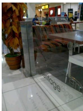
Gambar 3. Dinding masif Solaria BEC

Penggunaan material kaca dan stainless pada partisi restoran sangat disarankan karena mempunyai sifat bersih dan higienis. Penggunaan material yang transparan memberikan efek luas pada area disekitarnya, sehingga area makan tidak terkesan terbatas. Tinggi dinding partisi ini tidak mengganggu aspek visual di sekitarnya, karena tingginya yang rendah dan menggunakan material kaca. Hal ini dilakukan karena Solaria BEC berada di area food court .