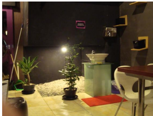
Dinding masif Solaria PVJ

Bahan lantai teraccota itu terdapat di pintu masuk restoran solaria PVJ. sedangkan area bebatuan berada di lantai 2 restoran solaria PVJ. Elemen ini memberikan kesan memecah kekakuan akan lantai di sebelahnya yang menggunakan lantai granit berukuran 60x60cm. Sedangkan pada solaria BEC, material lantai menggunakan lantai asli dari bangunan asal itu sendiri yaitu granit tile 60x60cm berwarna putih