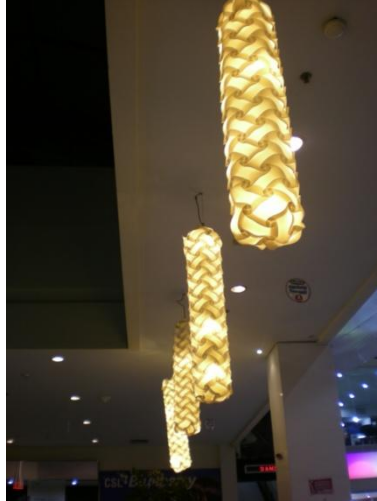
Lampu gantung Solaria BEC

Sedangkan pada solaria BEC komponen ceiling menggunakan bahan material gypsum yang sudah ada pada gedung BEC itu sendiri. Dan elemen ceiling ini menggunakan lampu gantung yang berbeda.