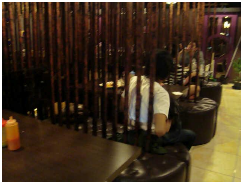
Dinding masif Solaria PVJ

Dinding masif pada area makan lebih di dominasi material besi hollow yang menggunakan finishing teknik cat bakar dan berwarna gelap, hal ini memberikan kesan lebih tertutup dan memiliki tingkat privasi cukup tinggi. Sistem penggunaan besi dari lantai hingga ceiling merupakan teknik sederhana untuk memecah suatu ruang menjadi beberapa area di dalamnya. Penggunaan partisi sekeliling area makan mempengaruhi masuknya sinar lampu ke dalam area makan yang menghasilkan bayangan - bayangan yang unik