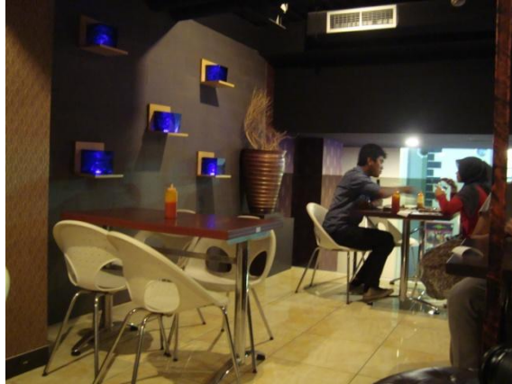
Dinding Solaria PVJ

Elemen interior di dinding solaria PVJ ini menggunakan lampu dengan material akrilik berwarna biru, dengan base kayu finishing cat vernis. Elemen interior ini memberikan aksen warna pada dinding yang berwarna gelap melalui pantulan cahaya dari akrilik biru tersebut. Sedangkan pada solaria BEC tidak menggunakan komponen maupun elemen pada dindingnya. karena lokasi solaria BEC berada di kawasan foodcourt .