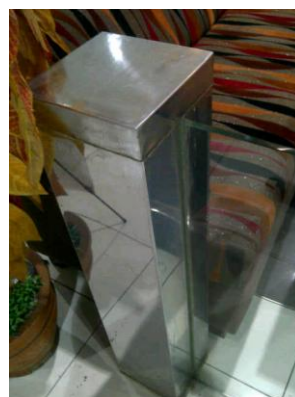
Gambar 4. Dinding masif Solaria BEC