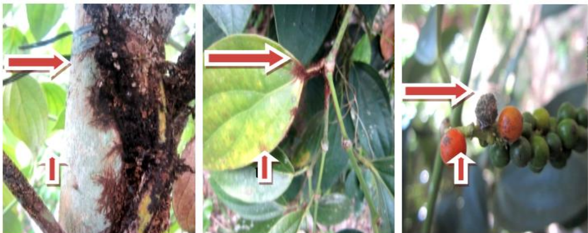
Gambar 1. a. Batang tanaman lada diselimuti miselium hawar beludru. b. Daun tanaman lada mulai menguning karena penyakit hawar beludru. c. Buah lada busuk karena penyakit wahar beludru.

Gejala pada daun, daun muda dan tua ditandai dengan terjadinya perubahan warna daun, dari hijau menjadi kuning kecoklatan yang dimulai dari tangkai daun dan menyebar ke permukaan daun, sehingga daun menjadi gugur. Gejala pada buah, buah akan mengecil, buah hampa (tidak berisi), dan kemudian menjadi busuk. Gejala di atas adalah gejala penyakit yang disebabkan Septobasidium sp. Hal ini sesuai dengan Semangun (1996), gejala tanaman yang disebabkan Septobasidium sp, adalah pada awal miselium berwarna kecoklatan, miselium berkembang mengelilingi/membungkus cabang atau ranting yang terinfeksi, dengan diameter 1 mm dan panjang 25 cm. Cabang dan ranting yang terinfeksi akan mudah patah dan gugur, sedangkan pada buah, buah tidak berisi (kosong) dan busuk.