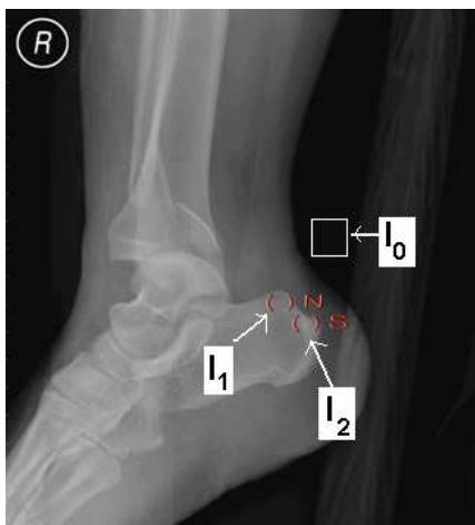
Gambar 1. ROI tulang osteosklerotik

I_2 : tingkat keabuan ROI radiograf tulang osteosklerotik