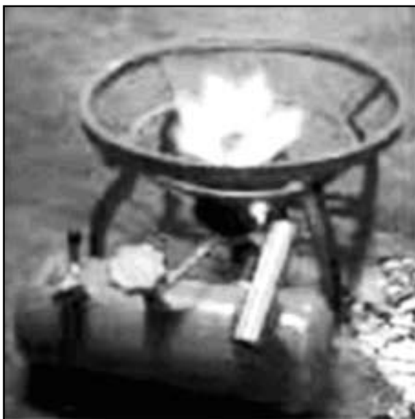
Gambar 4. Kompor bertekanan tipe ITB (Reksowardojo, 2005)