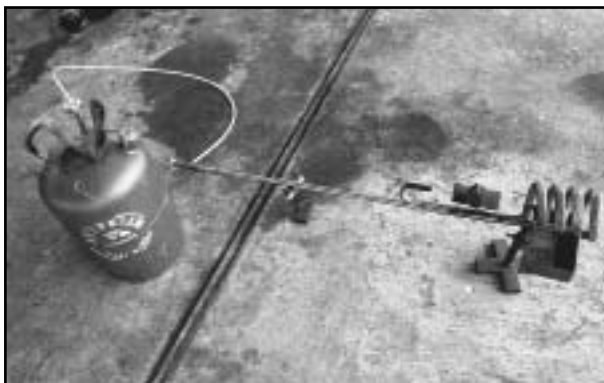
Gambar 2. Kompor bertekanan tipe spiral dengan tabung.

Kegiatan modifikasi yang dilakukan adalah menambah pipa pelindung dan penerus nyala api