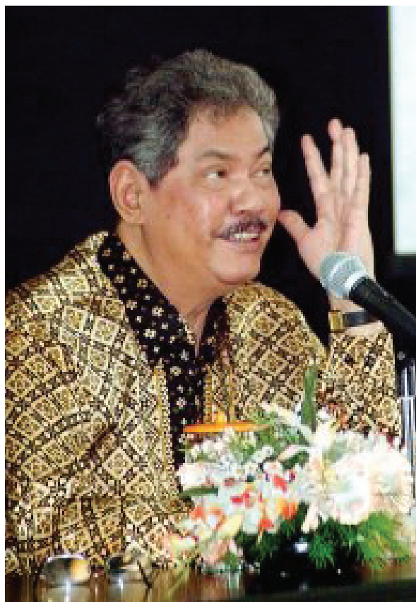
Prof Dr Malik Fajar, MSc (Menteri Agama, 1998-1999, dan Menteri Pendidikan Nasional, 2001-2004)