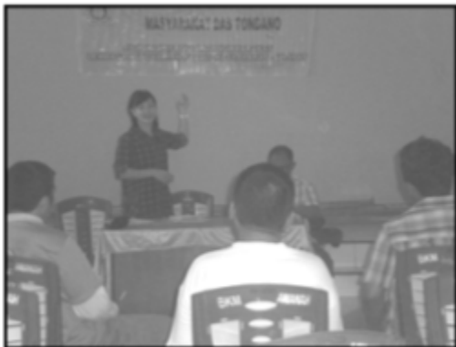
Gambar 1. Kegiatan Sosialisasi dan Pelatihan