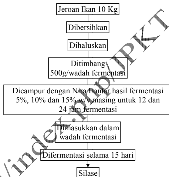
Gambar 2. Proses pembuatan silase jeroan cakalang.

puti pengukuran pH dan Total Asam menurut metode Nout et al. (1989) yang dimodifikasi oleh Ijong dan Ohta (1996), sedangkan analisa kadar protein kasar dilakukan dengan metode Kjeldahl (Sudarmadji, et al. , 1989). Semua data yang diperoleh dari hasil analisa laboratorium selanjutnya dihitung menggunakan Anova yang diintegrasikan dengan uji Duncan (Gasperz, 1994).