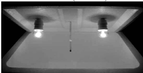
Gambar 1. Fermentor.

Bahan baku yang digunakan adalah limbah jeroan ikan cakalang yang diperoleh dari tempat pengolahan ikan di Kelurahan Pasir Panjang, Kota Kupang, NTT. Sedangkan nira lontar diperoleh dari petani selanjutnya difermentasi selama 12 dan 24 jam untuk digunakan sebagai sumber bakteri asam laktat. Peralatan yang digunakan untuk wadah fermentasi berupa toples kaca yang dilengkapi dengan tutup dan untuk proses fermentasinya ditempatkan dalam sebuah inkubator yang dirancang menggunakan kotak gabus sintesis berdimensi 49x39x32 cm, dan pada tutupnya dipasang 2 buah lampu pijar 5 watt yang berfungsi sebagai sumber panas untuk menghasilkan suhu fermentasi antara 35–45°C (Gambar 1).