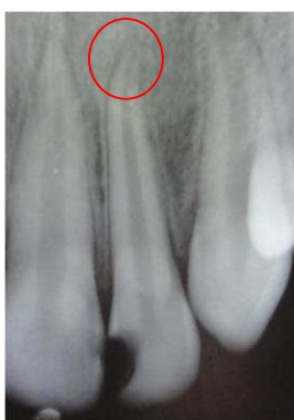
Gambar 2. Hasil radiografi periapikal yang diambil 15 Mei 2010, tampak ujung akar gigi 22 yang belum menutup sempurna.

Pemeriksaan obyektif menunjukkan, pada elemen 22 terdapat karies kedalaman pulpa, tes vitalitas gigi 22 menunjukkan sondasi (-), CE (-), perkusi (+), dan palpasi (+). Terdapat pembengkakan gingiva di bagian labial gigi 22 dengan diameter 5 mm. Hasil pemeriksaan radiografi periapikal menunjukkan terdapat area radiolusen pada mahkota gigi 22 mencapai pulpa, pada ujung apeks terdapat area radiolusen, yang menunjukkan bahwa ujung akar gigi belum menutup sempurna.