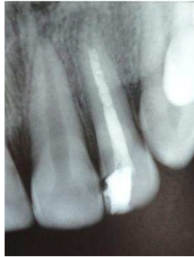
Gambar 3. Pada ronsen foto tampak pasta kalsium hidroksid yang mengisi saluran akar pada gigi 22 yang ujung akarnya belum menutup sempurna.