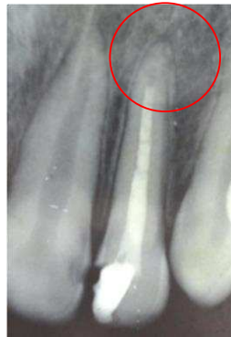
Gambar 4. Terdapat area radiopak dengan sedikit area radiolusen pada ujung akar (walaupun sudah lebih sedikit area radiolusen yang tampak dibandingkan pada kunjungan sebelumnya).