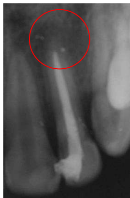
Gambar 5. Tampak area radiopak pada ujung akar dan area radiolusen disepanjang saluran akar pasca obturasi