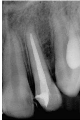
Gambar 6. Radiograf gigi 22 1 minggu pasca pengisian saluran akar/ obturasi. Tampak radiolusen pada saluran akar sampai ke ujung akar. Ujung akar sudah menutup sempurna.