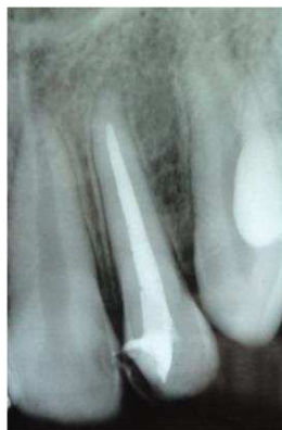
Gambar 7. Radiograf gigi 22 pada 12 bulan pasca pengisian saluran akar/ obturasi. Tampak area radiopak pada saluran akar sampai ke ujung akar, tidak ada area radiolusen pada periapikal yang merupakan tanda patologis.