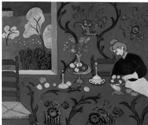
Henri Matisse. Red Room. 1908-1909.