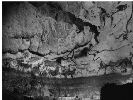
Lukisan Gua Prasejarah