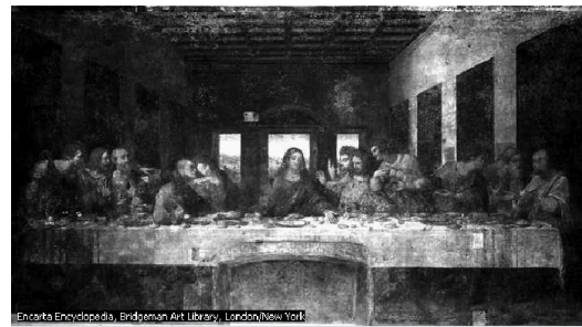
Last Supper by Leonardo da Vinci