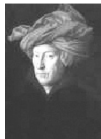
Jan van Eyck. Man in a Red Turban. 1443

Pada abad ke 14 material cat yang dipilih oleh para pelukis adalah tempera. (campuran pigmen dengan warna emulsi seperti kuning telur). Kemudian pada abad ke-8 telah dikembangkan pemakaian sejenis minyak untuk mencampur pigmen, warna yang memungkinkan para seniman bekerja lebih leluasa karena menghasilkan gradasi warna yang lebih soft .