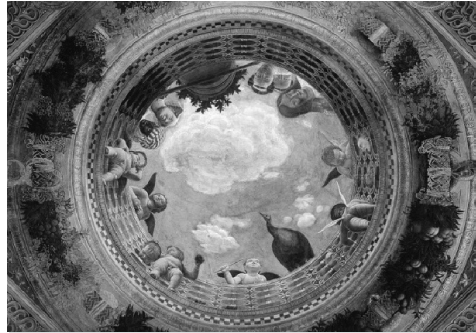
Andrea Mantegna. Ceiling of the Camera Degli Sposi. 1474

Para seniman mempelajari matematika dan memanfaatkannya untuk menciptakan perspektif garis dan perhitungan sehingga semua objek lukisan, relief dan patung-patung dibuat dan saling berhubungan dengan proporsi dan rasio. Perspektif merupakan penciptaan ilustrasi ruang, jarak dan kedalaman. Penemuan per-