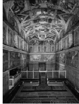
Interior of Sistine Chapel. Ceiling by Michael Angelo. 1473 Sumber: Gardner Art through the Ages. 2001; 648

Fresco (Fresco="fresh"= Italia) adalah memanfaatkan pigmen warna diatas dinding yang masih basah. Pada periode Renaisans awal, digali kembali teknik melukis mural yang disebut fresco. Cara melukis dengan teknik fresco memungkinkan mendapatkan hasil lukisan yang permanen, stabil dan tahan lama setelah dinding (plester) yang telah dilukisi mengering. Teknik fresco ini kemudian sangat populer pada masa Renaisans dan dikembangkan sebagai teknik melukis yang dipilih oleh para seniman besar pada masa itu ketika master piece yang mereka buat (Contohnya: Sistine Chapel oleh Michael Angelo; Last Supper oleh Leonardo da Vinci).