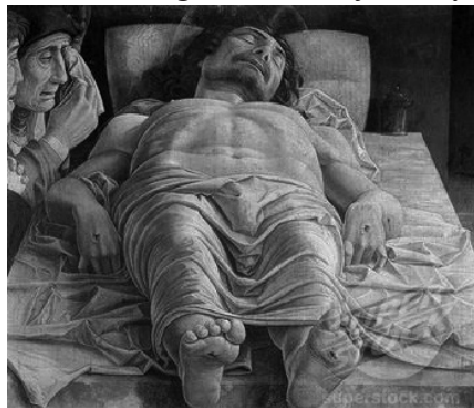
Andrea Mantegna. Dead Christ. 1501. Tempera. 1501

spektif membawa kesadaran baru pada manusia mengenai beberapa hal; menggambar/melukis memiliki aturan, yaitu matematika, realistik dapat digambarkan dengan alat matematika, hukum-hukum matematika memberikan struktur pada ruang visual, pada struktur ruang visual tsb, pengamat berada di tengah-tengah. Kesadaran akan adanya jarak pengamat objek dan distorsi visual karena adanya jarak antara pengamat dan objek sehingga terbentuk dua kelompok objek dan pengamat (subjek). Kemajuan teknik melukis dengan perspektif terus berkembang, dan menyebar tidak hanya di daerah Florence, namun ke seluruh Eropa, tercatat beberapa seniman menghasilkan banyak karya yang bermutu, salah satunya adalah seorang seniman dari Padova (Padua) yaitu Andrea Mantegna (1431-1506) yang berhasil membuat beberapa karya yang memperlihatkan kemampuan yang tinggi dalam memanfaatkan perspektif. Leonardo da Vinci dalam Capra (2010; 9) menjelaskan bahwa lukisan adalah perspektif yang menyatukan dan perajut integral yang berlaku diseluruh bidang