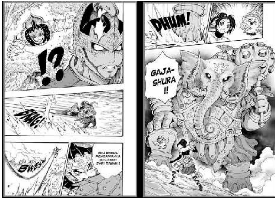
Gambar 1. Sosok Gatotkaca dan Antaredja dalam komik Garudayana oleh Is Yuniarto