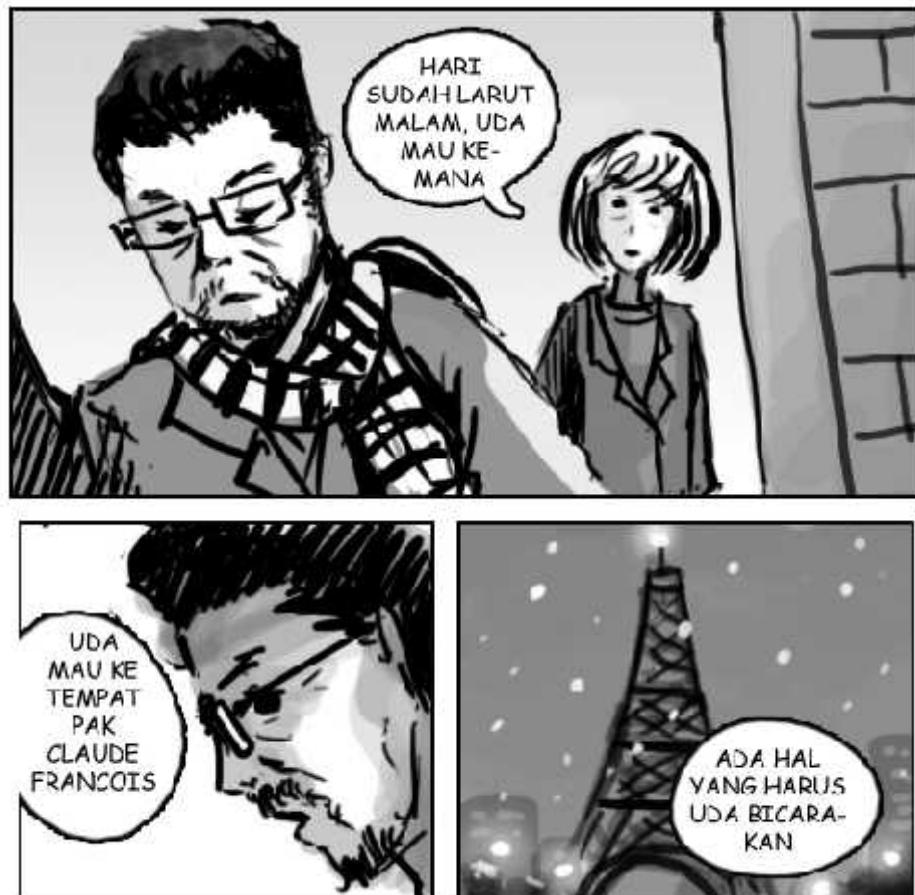
Gambar 7. Sedikit perubahan pada pencitraan akan menghasilkan tafsir yang berbeda Gambar oleh Olvyanda Ariesta, 2013

masyarakat Minangkabau, dengan adanya dialog yang disampaikan oleh tokoh wanita terhadap tokoh pria dengan panggilan “uda”, serta tampilan Rumah Gadang di panil terakhir. Kemudian dari segi pakaian yang ditampilkan, pembaca akan mendapatkan informasi bahwa kejadian ini tidak berlangsung di sebuah kota besar, melainkan di sebuah kampung di masa lalu.