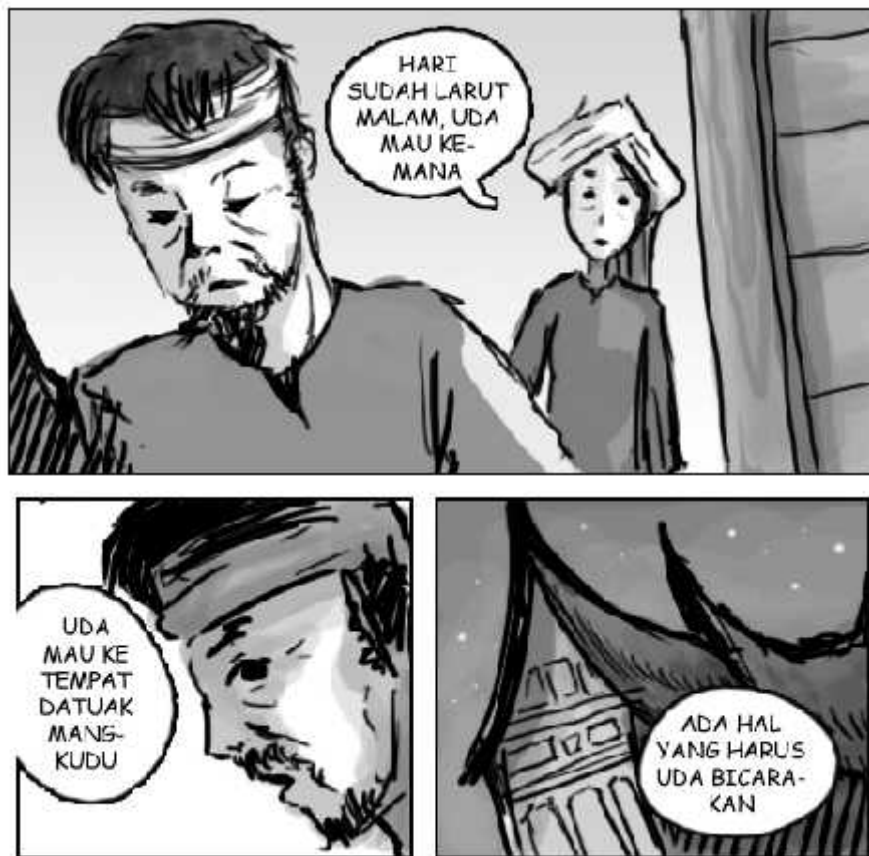
Gambar 6. Komik yang menampilkan kebudayaan Minangkabau Gambar oleh Olvyanda Ariesta, 2013

Di dalam sebuah komik, setiap lembaran halaman merupakan teks yang harus dibaca untuk memahami fenomena kebudayaan yang ditampilkan di dalam komik. Segala hal yang dinarasikan di dalam komik, baik itu komik yang menggambarkan realitas, ataupun fantasy (khayalan) merupakan teks untuk memahami fenomena yang terjadi di dalam komik yang dibaca.