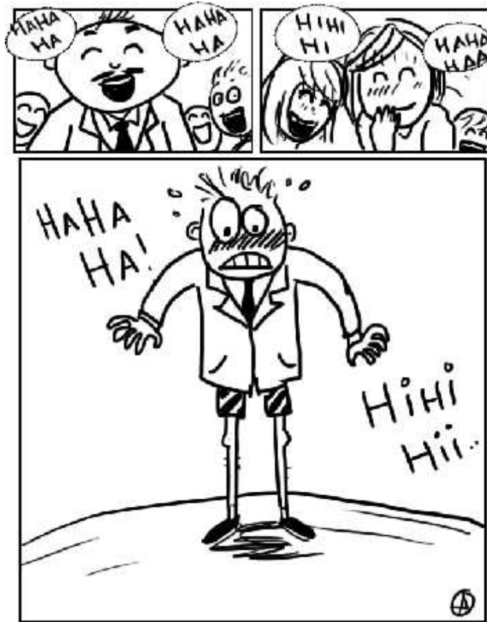
Gambar 4. Komik yang menggambarkan kebudayaan sebagai sistem kognitif (pengetahuan) Gambar oleh Olvyanda Ariesta, 2013

Di samping aspek mental di atas, budaya juga dipandang sebagai aspek perilaku ( behavior aspect ). Perilaku merupakan apa yang dilakukan ( do ) oleh manusia dan menghasilkan sesuatu yang disebut dengan apa yang manusia miliki ( have ). Aspek perilaku berupa sesuatu yang tampak dan bisa diamati oleh pancaindra ( touchable ). Sesuatu tersebut bisa berupa karya seni, bahasa, dan segala kebendaan yang berasal dari masyarakat. Contohnya adalah bahasa ( language ); apapun bahasa di seluruh dunia, ia memiliki susunan yang terstruktur (terdiri dari subjek , prediket , dan objek ), walau secara penuturan ( parole ) ia berbeda.