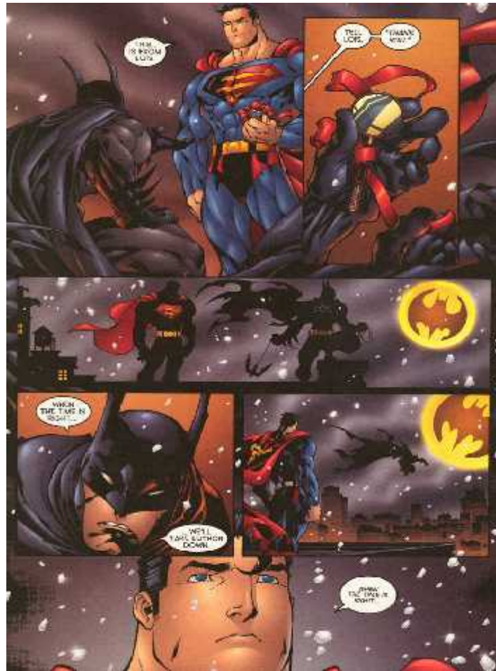
Gambar 5. Komik superhero Amerika secara tidak sadar menanamkan pemahaman bahwa Amerika adalah negara superpower . Sumber: Superman vs Batman oleh Joe Madueira, 2003.

Inilah yang disebut Seno Gumira Ajidarma bahwa komik sebagai situs perjuangan ideologi. 13 Maksudnya adalah di dalam komik tersebut bisa menjadi media dalam menyerang pembaca dengan ideologi-ideologi tertentu, sehingga hal itu berulang terus-menerus, hingga ideologi tersebut akan tertanam pada diri pembaca yang akan mempengaruhi pola pikir dan perilaku. 14