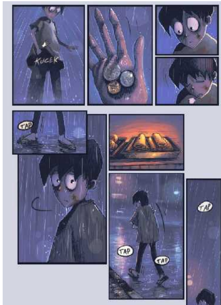
Gambar 3. Pengotakan adegan sehingga membentuk narasi Sumber: Komik Indahnya Berbagi oleh Olvyanda Ariesta, 2013

dikotakkan dan disusun berdampingan dengan kotak lain yang berisi tindakan lain.