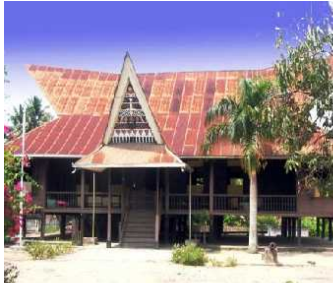
Gambar 1 Bagas godang , yang berfungsi sebagai kediaman raja

Dalam sistem kemasyarakatan Mandailing, Huta yang sudah merupakan sebuah bona bulu harus mempunyai bagas godang dan sopo godang . Bagas merupakan bangunan arsitektur yang digunakan sebagai tempat kediaman raja, sementara itu sopo godang digunakan sebagai balai pertemuan.