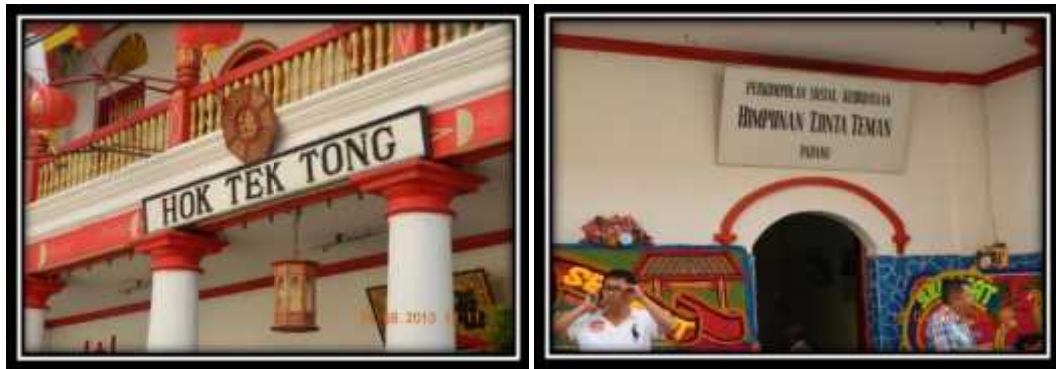
Gambar 2 Gedung Perkumpulan sosial dan Kebudayaan Hok Tek Tong atau yang disebut dengan Himpunan Tjinta Teman Padang. Berdiri pada tahun 1863 di Kota Padang.