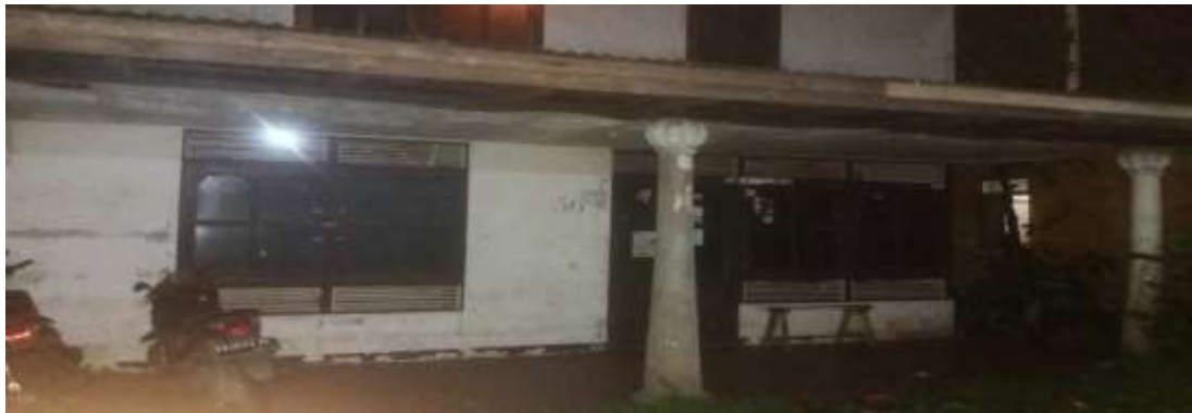
Gambar 1. Kos Di RT 03 (Kos laki-laki)

Observasi penelitian dilakukan pada tanggal 17, 21 dan 30 Juni 2016. Pada tanggal 17 Juni 2016 pukul 22.00 wib peneliti melakukan observasi pertama dengan melakukan pengamatan pada kos RT 03 untuk melihat apakah ada tamu yang berlawanan jenis yang datang bertamu melewati jam yang telah disepakati yaitu pukul 22.00 wib.