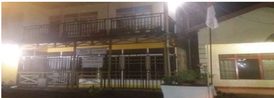
Gambar 2. Kos di RT 04 (Kos campuran: Kos wanita di atas dan Kos laki-laki di bawah)

Dari gambar 1. di kos RT 03 terlihat tidak ada tamu yang melewati jam bertamu, pintu kos tertutup yang ada hanya sebuah motor milik penghuni kos. Bahkan suara berisik dari dalam kos juga tidak kedengaran. Begitu pula dengan observasi kedua dan ketiga yang dilakukan oleh peneliti bahwa tidak ada yang melewati jam bertamu yaitu pukul 22.00 wib.