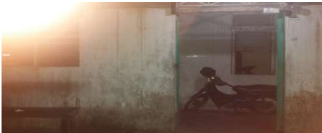
Gambar 3. Kos di RT 03 (Kos Laki-Laki)

Observasi penelitian dilakukan pada tanggal 17, 21 dan 30 Juni 2016. Pada tanggal 17 Juni 2016 pukul 22.00 wib peneliti melakukan observasi pertama dengan melakukan pengamatan pada kos RT 03 untuk melihat apakah ada tamu yang berlawanan jenis yang datang bertamu melewati jam yang telah disepakati yaitu pukul 22.00 wib. Seperti halnya observasi pertama tidak ada yang melakukan pelanggaran yang melewati jam bertamu. Kemudian pada observasi ketiga yang peneliti lakukan Temuan Observasi pada tanggal 30 Juni 2016 pukul 21.00-22.30 wib. Pada observasi ketiga ini peneliti menemukan peraturan yang tertulis di dinding kos.