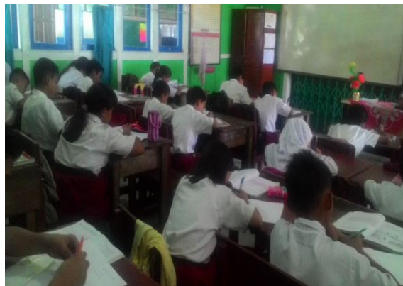
Gambar 1. Suasana Kelas Saat Pembelajaran

Dengan demikian, kemampuan menulis karangan narasi siswa dengan menggunakan model CIRC lebih tinggi dari kemampuan menulis karangan narasi siswa tanpa menggunakan model CIRC . Namun secara keseluruhan, kemampuan menulis karangan narasi siswa pada kelas kontrol dan kelas eksperimen mengalami peningkatan setelah diberikan perlakuan yang berbeda.