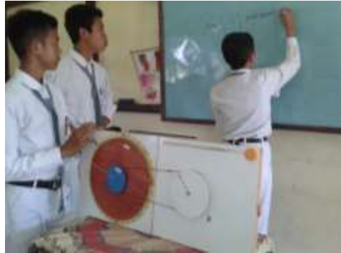
Gambar 2. Peragaan alat peraga Portable Board

Hasil uji hipotesis membuktikan bahwa perubahan kemampuan siswa kelas eksperimen dan kelas kontrol berbeda signifikan dengan harga effect size sebesar 0,33. Artinya pembelajaran berbantuan alat peraga Portable Board cukup berpengaruh terhadap hasil belajar siswa kelas X SMA Negeri 1 Jelimpo. Hasil effect size yang diperoleh sesuai dengan penemuan Hattie (1999) bahwa effect size media pembelajaran terhadap hasil belajar siswa berada pada harga 0,3. Kesimpulan yang diperoleh relevan dengan hasil penelitian Lusitadewi (2012) menunjukkan bahwa dalam tiga kali replika prestasi belajar siswa kelas eksperimen pada materi perpindahan kalor yang mengikuti pembelajaran menggunakan alat peraga sederhana secara konsisten lebih baik dari pada siswa kelas kontrol yang mengikuti pembelajaran tanpa menggunakan alat peraga sederhana, dengan hasil uji t taraf signifikansi 5% diperoleh t_{hitung} pertama 8,5434; kedua 3,1316; ketiga 9,6352.