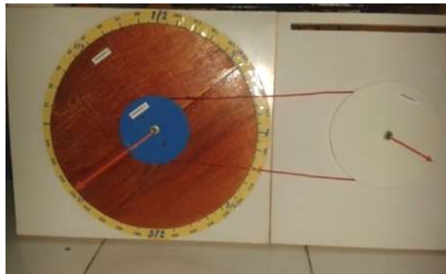
Gambar 1. Tampilan alat peraga Portable Board

Portable Board disertai LKS dengan sistem kelompok dan bergantian. Hal ini dikarenakan salah satu bentuk keterbatasan dalam penelitian ini yaitu keterbatasan jumlah alat peraga yang hanya terdiri satu set dan keterbatasan alokasi waktu pembelajaran yang harus disesuaikan. Siswa terbagi menjadi 6 kelompok dan setiap kelompok secara bergantian diberi kesempatan untuk melakukan penyelidikan terhadap salah satu konsep dan memperagakannya kepada kelompok lainnya misalnya konsep kecepatan sudut. Pada pertemuan pertama: kelompok 1 dan 2 ditugaskan melakukan penyelidikan konsep definisi gerak melingkar; kelompok 3 dan 4 melakukan penyelidikan konsep kecepatan sudut, kelompok 5 melakukan penyelidikan konsep hubungan kecepatan sudut dan kecepatan linier dan kelompok 6 melakukan penyelidikan konsep frekuensi dan periode. Pada pertemuan kedua: kelompok 1, 2 dan 3 ditugaskan melakukan penyelidikan konsep percepatan sentripetal; sedangkan kelompok 4, 5 dan 6 ditugaskan melakukan penyelidikan konsep hubungan roda-roda.