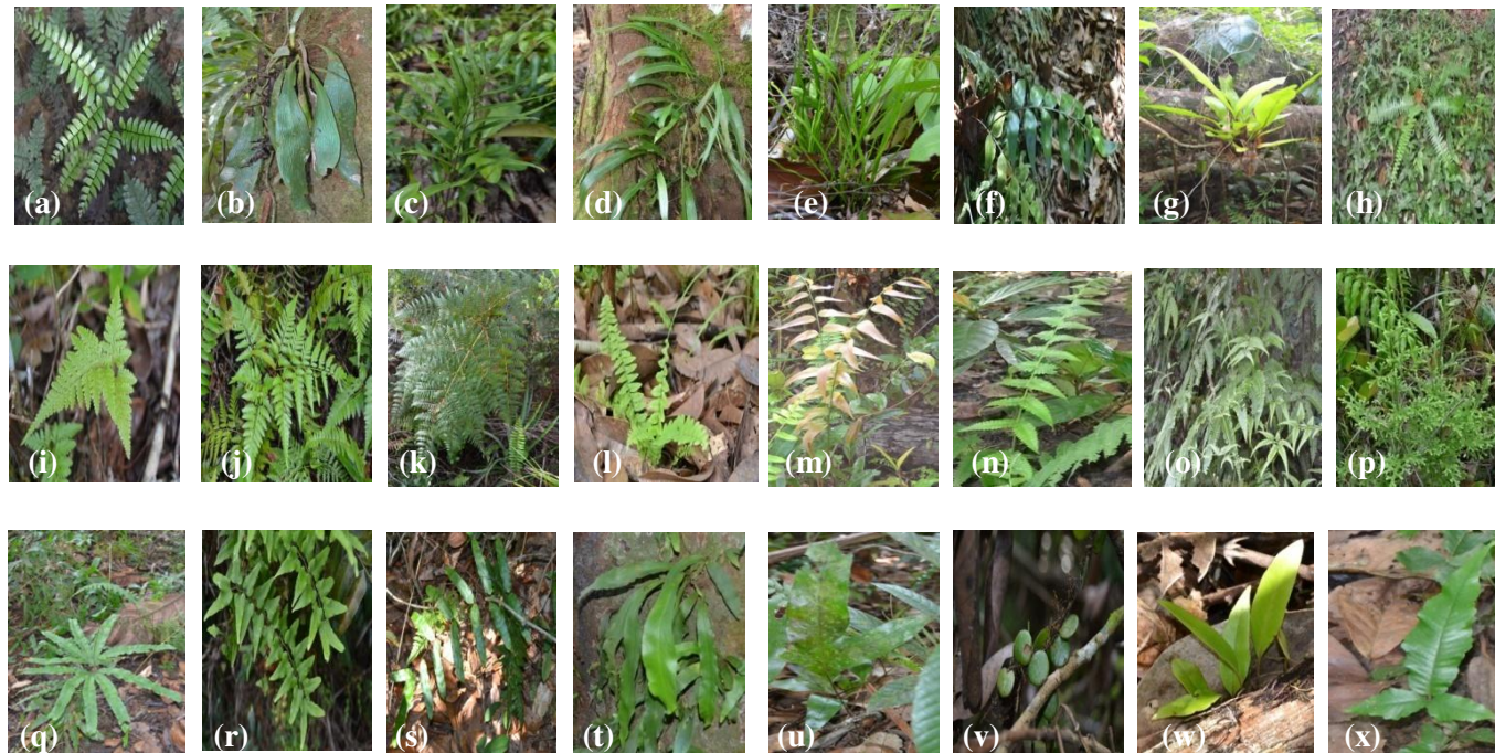
Gambar 2: Jenis-jenis tumbuhan paku dari hasil inventarisasi tumbuhan paku di Hutan Adat Desa Teluk Bakung.

(a) Adiantum latifolium Lam., (b) Antrophyum reticulatum (Forst) Kaulf., (c) Taenitis blechnoides Sw., (d) Vittaria ensiformis Sw., (e) Vittaria scolopendrina (Borrey) Thw., (f) Asplenium macrophyllum Sw., (g) Asplenium nidus Linn., (h) Asplenium normale Don., (i) Davallia denticulata (Brum) Mett., (j) Davallia solida (Forst.) Sw., (k) Histiopteris incisa (Thbg.) J. Sm., (l) Nephrolepis bisserata (Sw.) Schott., (m) Stenochlaena palustris (Burm.) Bedd., (n) Thelypteris noveboracensis (L.), (o) Gleichenia linearis (Burm.) Claeke., (p) Lycopodium cernuum L., (q) Lygodium circinatum Sw., (r) Lygodium scandens (L.) Sw., (s) Polypodium verrucosum (Hook) Wall., (t) Loxogramme avenia (Bl.) Presl., (u) Phymatodes scolopendria Burm., (v) Pyrrrosia nummularifolia Sw., (w) Pyrrrosia lanceolata (Linnaeus) Farwell, (x) Pronephrium triphyllum (Sw.) Holtt.