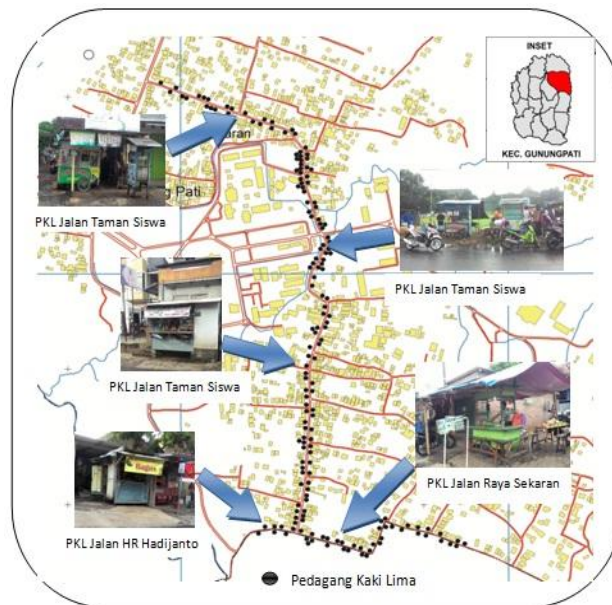
Gambar 3.1. Peta Lokasi Pedagang Kaki Lima Di Kawasan Pendidikan Di Gunungpati (Analisis, 2016)

Ruang lingkup spasial mikro yang menjadi studi dalam penelitian ini adalah Kelurahan Sekaran yang menjadi wilayah pusat persebaran PKL. Adapun PKL yang termasuk dalam penelitian ini adalah PKL yang berada di Jalan Taman Siswa yang berbatasan dengan Jalan Banaran Raya, Jalan Mr. Koesbiyono-Raya Sekaran-Raya Patemon yang berpotongan dengan Jalan Kolonel HR Hadijanto, serta sebagian penggal Jalan Kolonel HR Hadijanto yang berpotongan dengan Jalan Mr. Koesbiyono. Jalan-jalan tersebut merupakan jalan utama yang dikelilingi oleh PKL di Kelurahan Sekaran. Adapun koridor jalan persebaran lokasi PKL di daerah wilayah studi dapat dilihat pada Gambar 3.1 berikut.