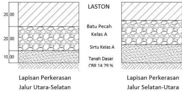
Gambar 2 Tebal Lapisan Perkerasan