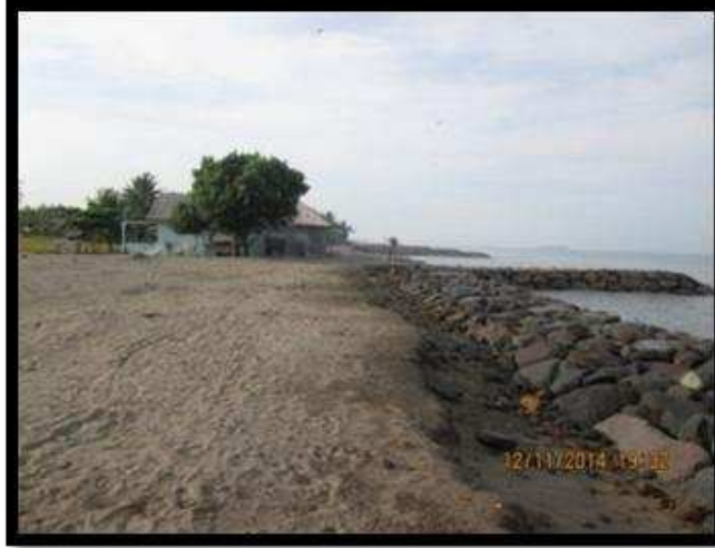
Gambar 1. Tanggul Batu Pemecah Ombak Kecamatan Pariaman Utara (analisis, 2015)

Bagi responden yang bekerja sebagai nelayan melakukan perubahan pola penangkapan ikan. Bagi masyarakat lainnya melakukan adaptasi dengan melakukan penghematan dalam pemakaian air bersih. Untuk responden yang bertempat tinggal dekat dengan pantai, 68% berniat untuk pindah rumah menjauhi pantai. Mereka beralasan karena ingin hidup lebih aman. Tetapi pindah tidak dilakukan dalam waktu dekat. Mereka berniat pindah saat kondisi kawasan pesisir sudah memberikan bahaya bagi kelangsungan hidup mereka. Responden yang tidak berniat pindah tetap tinggal dirumah masing-masing karena fenomena yang terjadi menurut mereka hanya siklus alam yang akan terus berulang kali.