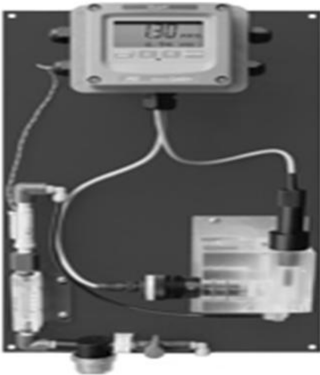
Gambar. 4. Recidual chlorine monitoring (RCM) pada Sistem