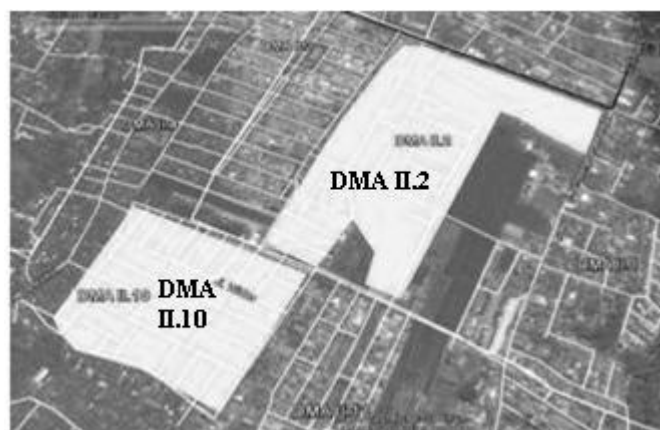
Gambar. 2. DMA II.2 dan DMA II.10

Jaringan distribusi air siap minum untuk DMA II.2 dan DMA II.10 menggunakan sistem pengaliran distribusinya dengan sistem gravitasi dari Tandon Wendit 1. Pada kedua DMA tersebut untuk sistem jaringan induknya memanfaatkan sistem campuran antara sistem loop (melingkar) dengan sistem branch (cabang). Analisa jaringan sistem distribusi air siap minum untuk DMA II.2 dan DMA II.10 ini menggunakan program EPANET 2.0 , Analisa dilakukan pada kecepatan aliran air, tekanan, dimensi pipa, kualitas sisa klor dan lain sebagainya.