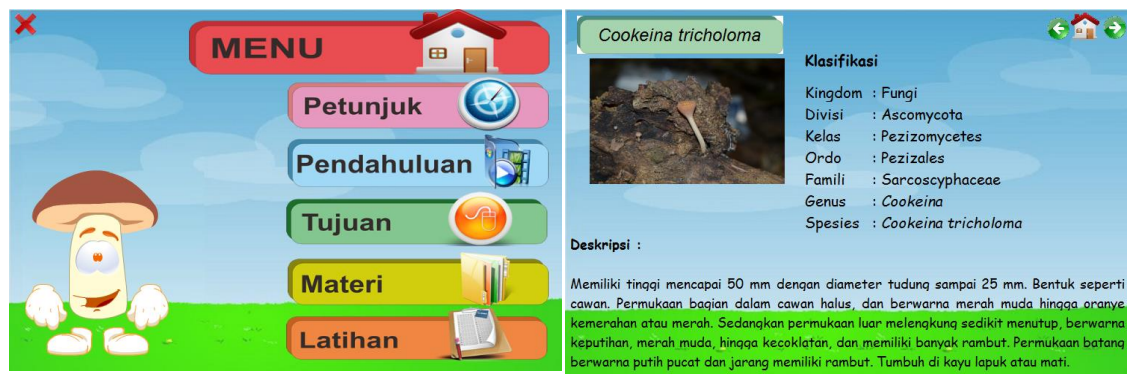
Gambar2. Isi Multimedia Interaktif

Validasi multimedia interaktif dilakukan untuk mengetahui kelayakan atau kevalidan media untuk proses pembelajaran. Multimedia interaktif di validasi oleh sepuluh (10) orang validator yang terdiri dari lima (5) validator ahli media dan lima (5) validator ahli materi. Lembar validasi multimedia interaktif untuk validator ahli media terdiri atas empat (4) aspek (Tabel 1) dan validator ahli materi terdiri atas tiga (3) aspek (Tabel 2), yang digunakan untuk menguji layak atau tidaknya multimedia interaktif digunakan sebagai media pembelajaran untuk materi jamur.