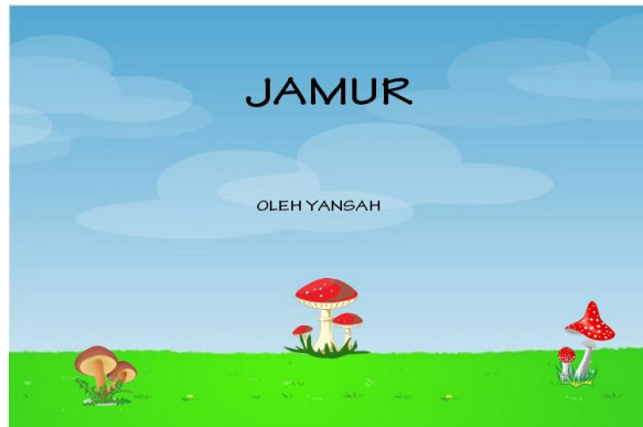
Gambar1. Multimedia Interaktif

penelitian inventarisasi jamur di kawasan Hutan Lindung Gunung Selindung. Berikut ini merupakan tampilan multimedia interaktif jamur.