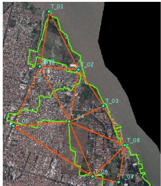
Gambar 3. Sebaran Titik Kontrol ( GCP )

Adapun sebaran titik kontrol yang juga telah dilakukan pengukuran yaitu: