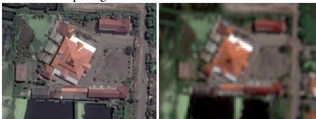
Gambar 2. Penampakkan citra setelah proses pansharpening (Kiri) dan sebelum (Kanan)

Proses pansharpening merupakan proses penggabungan dan penajaman citra band pankromatik digabungkan dengan citra band multispektral, pan-sharpening dilakukan untuk memudahkan proses interpretasi citra, penentuan titik kontrol dan tampilan citra yang memiliki visual yang baik serta memiliki resolusi yang tinggi. Pada penelitian kali ini data citra yang dilakukan Pansharpening citra satelit Pleiades 1B dengan contoh hasil seperti gambar dibawah ini: