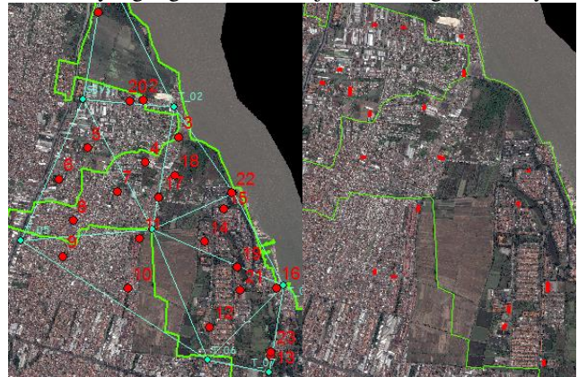
Gambar 4. Sebaran titik ICP (kiri) dan Titik Ukur Planimetris

Sedangkan untuk sebaran titik ICP dan titik ukur planimetris yang digunakan untuk uji ketelitian geometrik yaitu: