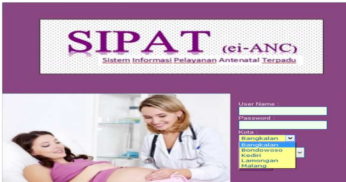
Gambar 1. Menu Login

PHP 5 dan JavaScript dan database Firebird . Aplikasi ini dirancang berbasis web dengan memanfaatkan Apache web server sebagai pendukungnya. Teknologi yang dibutuhkan untuk mengoperasikan SIPAT, yaitu Hardware dan Software: 1) Laptop/PC: Intel Pentium IV; OS: Multiplatform (misalnya Windows, Linux, Android); Memory 1 MB; Resolusi Monitor 1024 x 768; Browser Mozilla, 2) Tablet: OS Android Jelly Bean; Layar 7"; Brow-ser Mozilla.