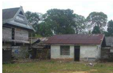
Gambar 1. Kondisi Bangunan Tempat Tinggal

Kondisi fisik bangunan tempat tinggal masyarakat di pulau Misool digolongkan dalam rumah permanen, rumah semi permanen, dan rumah tidak permanen. Berikut adalah beberapa gambar mengenai kondisi bangunan tempat tinggal di kampung Waigama distrik Misool.