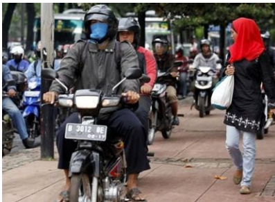
Kondisi pedestrian di DKI Jakarta

Penataan dan pengaturan penggunaan jalan dan fasilitas pendukungnya yang belum maksimal seperti penyediaan pedestrian bagi pejalan kaki, penyediaan jalur khusus sepeda motor dan lain – lain. Keadaan ini menyebabkan pedestrian yang seharusnya digunakan bagi pejalan kaki justru digunakan untuk sepeda motor, jika ini dibiarkan dapat mengakibatkan kecelakaan.