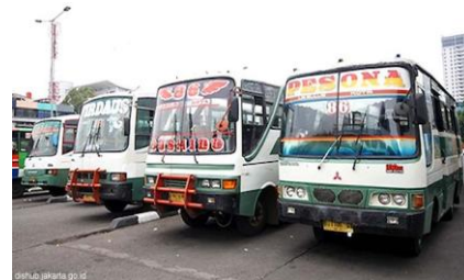
Kondisi angkutan umum di Jakarta (1)

Kondisi Infrastruktur jalan di DKI Jakarta kurang memadai, disebabkan karena jumlah kendaraan bermotor yang semakin bertambah sehingga perbandingan dengan kapasitas jalan menjadi tidak seimbang. Transportasi umum yang ada belum memadai dengan jumlah penduduk DKI Jakarta. Kondisi transportasi umum yang belum baik seperti bus – bus yang sudah tidak layak jalan karena tidak dirawat sehingga kadang knalpot sudah mengeluarkan asap masih dipakai. Keamanan di dalam angkutan umum juga dipertanyakan. Banyak terjadi kriminalitas di dalam angkutan umum.