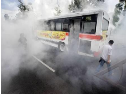
Kondisi angkutan umum di Jakarta (2)

Tingkat kedisiplinan dan kesadaran pengguna jalan yang semakin hari semakin parah. Dikarenakan jumlah kendaraan bermotor khususnya sepeda motor yang bertambah banyak menyebabkan antara kendaraan sepeda motor ini saling mendahului sehingga menyebabkan lalu lintas menjadi tidak terkendali.