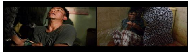
Gambar 3. Scene menunjukkan perjuangan Uje lepas dari jerat narkoba.