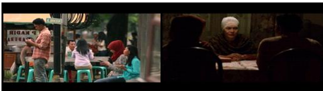
Gambar 7. Scene menunjukkan perjuangan Uje dan Pipik untuk menikah.

Rangkaian peristiwa setelah Uje bertaubat yang menunjukkan pesan pantang menyerah terdapat pada gambar 8. Pada analisis Metz gambar 8 merupakan bagian dari analisis ordinary sequence . Persepsi yang terbentuk dalam pemahaman Uje tentang pesan pantang menyerah terlihat pada pada gambar 8. Proses pemahaman tersebut termasuk dalam insight bergantung pada pengaturan secara eksperimental.