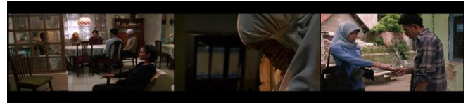
Gambar 2. Episodic sequence menunjukkan keikhlasan Pipik menerima kondisi Uje.