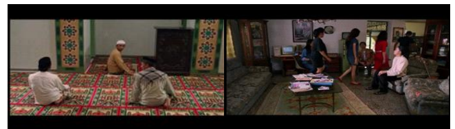
Gambar 4. Scene menunjukkan keikhlasan Uje menerima perlakuan orang-orang disekitarnya.