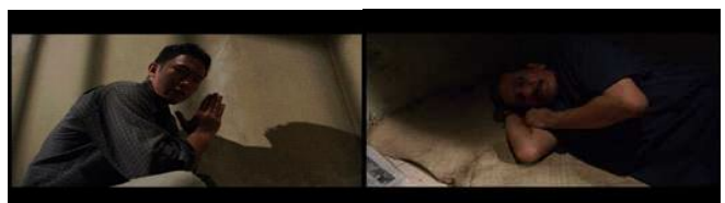
Gambar 6. Scene