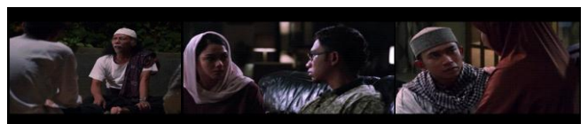
Gambar 12. Alternate syntagma menunjukkan kondisi Uje yang terus mencoba menjadi lebih baik dengan terus belajar dari orang-orang disekitarnya.