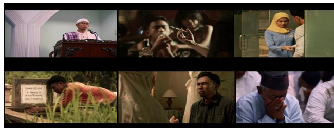
Gambar 8. Ordinary sequence menunjukkan proses Uje yang tidak mudah untuk kembali ke jalan kebaikan.