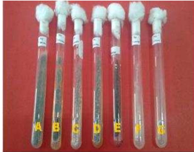
Gambar 1. Tampak atas dari isolat-isolat kapang yang ditemukan