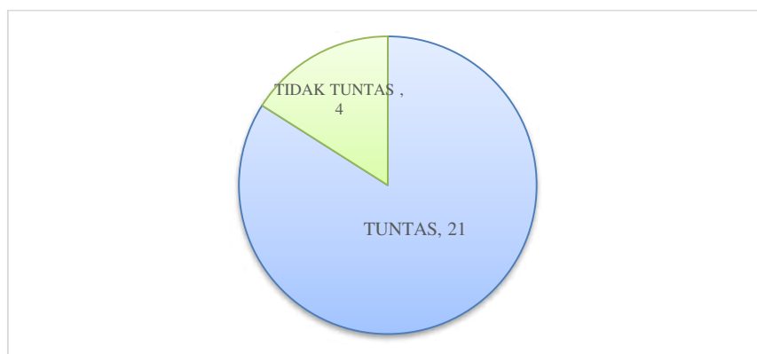
Gambar 2. Ketuntasan Hasil Belajar Siswa pada Materi Bangun Ruang Sederhana

Dari Gambar 1 di atas, persentase aktivitas guru terbesar adalah pada langkah menyelesaikan masalah kontekstual karena pada kegiatan ini, siswa lebih aktif bertanya sehingga guru memberikan saran dan bimbingan dalam penyelesaian masalah-masalah kontekstual. Berdasarkan pengamatan dari observer, diperoleh rata-rata keterlaksanaan perangkat pembelajaran adalah 3,15 sehingga menurut kriteria yang telah ditentukan, keterlaksanaan perangkat pembelajaran juga masuk kategori tinggi. Dengan keterlaksanaan perangkat dikatakan masuk kategori tinggi sehingga dapat dikatakan bahwa perangkat pembelajaran adalah praktis. Hasil uji coba LKPD mencakup 3 aspek, yaitu (1) penguasaan bahan ajar, (2) aktivitas siswa, dan (3) respon siswa. Rata-rata hasil belajar siswa adalah 77,6. Sesuai dengan KKM dari sekolah sebesar 75 dinyatakan siswa tuntas