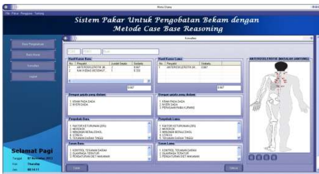
Gambar 7 : Tampilan Hasil Konsultasi

Jika kondisi sudah sesuai dengan yang di input -kan maka klik tombol “proses” maka akan muncul Form perbandingan antara data baru dengan data lama. Sehingga pada halaman ini ahli bekam/ asisten bekam dapat melihat gejala-gejala dan nilai yang dimiliki oleh data terdahulu.