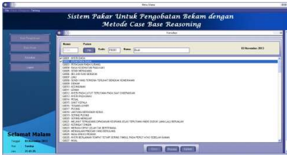
Gambar 7. Tampilan Form Menu Konsultasi

Jika kondisi sudah sesuai dengan yang di input -kan maka klik tombol “proses” maka akan muncul Form perbandingan antara data baru dengan data lama. Sehingga pada halaman ini ahli bekam/ asisten bekam dapat melihat gejala-gejala dan nilai yang dimiliki oleh data terdahulu.