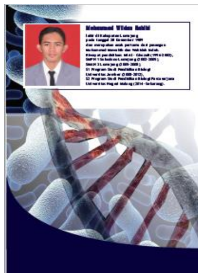
Gambar 3. Tampilan Cover Belakang

Cover belakang berisi profil penulis dan riwayat penulis (Gambar 3)