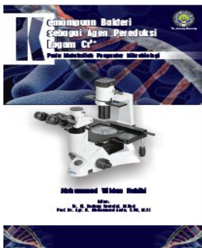
Gambar 2. Tampilan Cover Depan

Cover depan berisi judul buku: Kemampuan Bakteri sebagai Agen Pereduksi Logam Cr 6+ , selain itu juga terdapat identitas penulis, editor, dan institusi asal (Gambar 2).