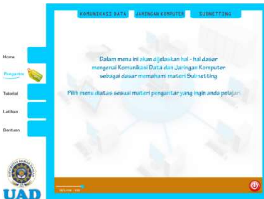
Gambar 3. Halaman pengantar