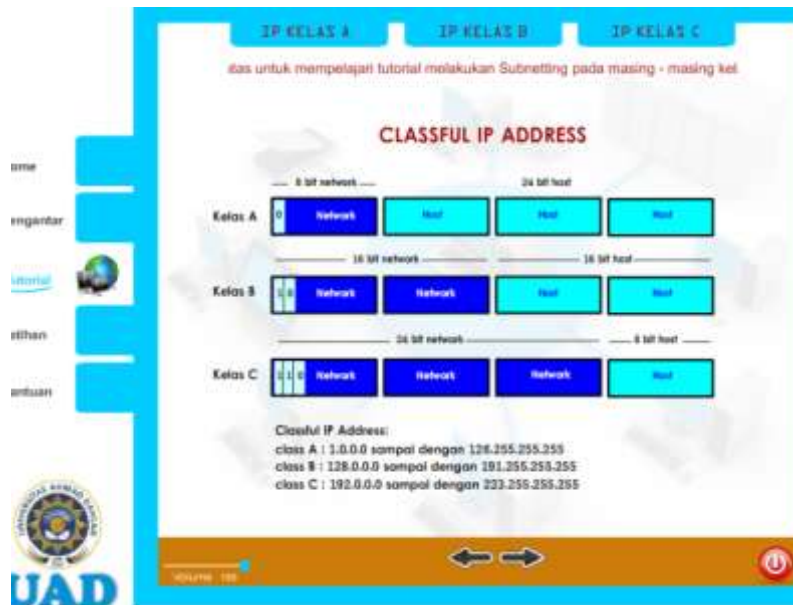
Gambar 4. halaman tutorial

Tampilan halaman tutorialan pada Gambar 4 berisi animasi dan penjelasan bagaimana cara melakukan perhitungan subnetting yang dilengkapi visualisasi dengan animasi serta audio berupa narasi.