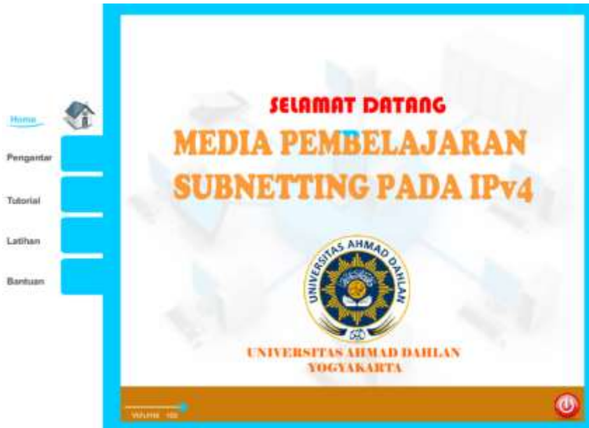
Gambar 2. halaman menu utama

Tampilan halaman menu utama pada Gambar 2 ditampilkan ketika tombol mulai pada halaman intro diklik. Terdapat Lima tombol utama yaitu tombol home, pengantar, tutorial, latihan, dan bantuan. Jika salah satu dari lima tombol tersebut ditekan, maka user akan dibawa ke halaman dari menu yang dipilih tersebut.