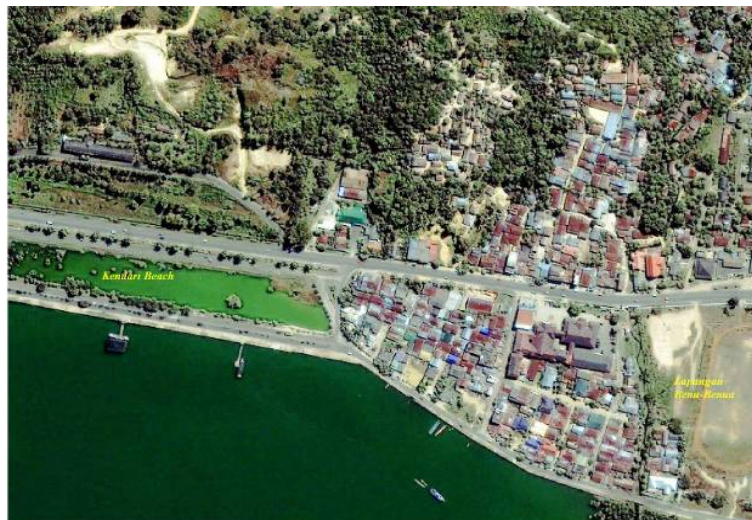
Gambar 1. Lokasi Pengambilan Air Laut

Sumber: KEPMENLH No. KEP-51/MENLH/10/1995