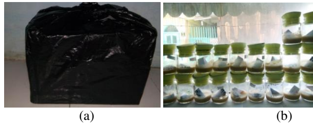
Gambar 2. Persilangan D. melanogaster pada kelompok perlakuan dan kontrol. (a) persilangan pada kondisi gelap dan (b) persilangan pada kondisi cahaya normal