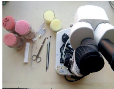
Gambar 3. Peralatan dan bahan yang diperlukan untuk persilangan dan pembiakan D. melanogaster .

Alat serta bahan yang terlihat pada gambar antara lain yaitu biakan 3 macam strain D. melanogaster , selang penyedot, kasa, gunting, kuas gambar, selang ampul, spons penyumbat, dan mikroskop stereo untuk pengamatan karakter tertentu pada D. melanogaster