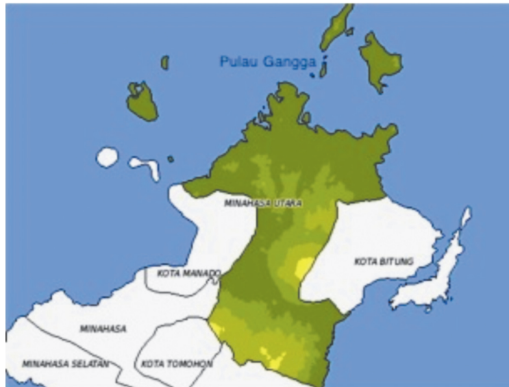
Gambar 1. Peta Kabupaten Minahasa Utara Provinsi Sulawesi Utara

Total responden pada studi kasus ini digenapkan menjadi 130 KK yang tersebar di Desa Gangga Satu dan Desa Gangga Dua.