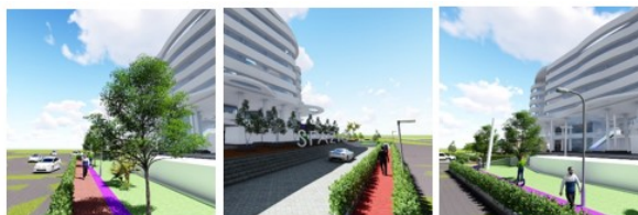
Gambar 1. Perspektif jalur pejalan kaki pada Gedung Spazio.