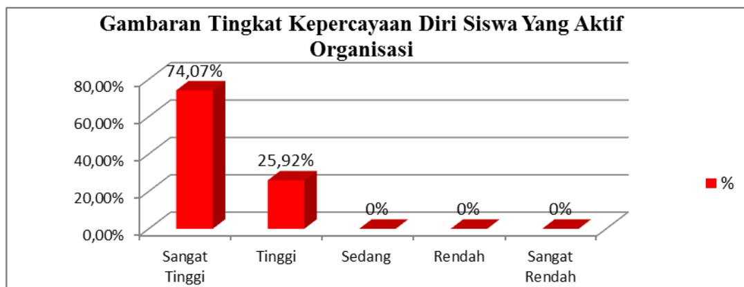
Gambar 1. Gambaran Tingkat Kepercayaan Diri Siswa Yang Aktif Organisasi.

Berdasarkan data tabel di atas, maka dapat disimpulkan bahwa gambaran kepercayaan diri siswa yang aktif organisasi 74.07% pada kategori sangat tinggi dan 25.92% pada kategori tinggi. Sedangkan pada kategori sedang, rendah dan sangat rendah tidak ada atau 0%. Untuk dapat lebih jelas, dapat dilihat pada gambar 1.