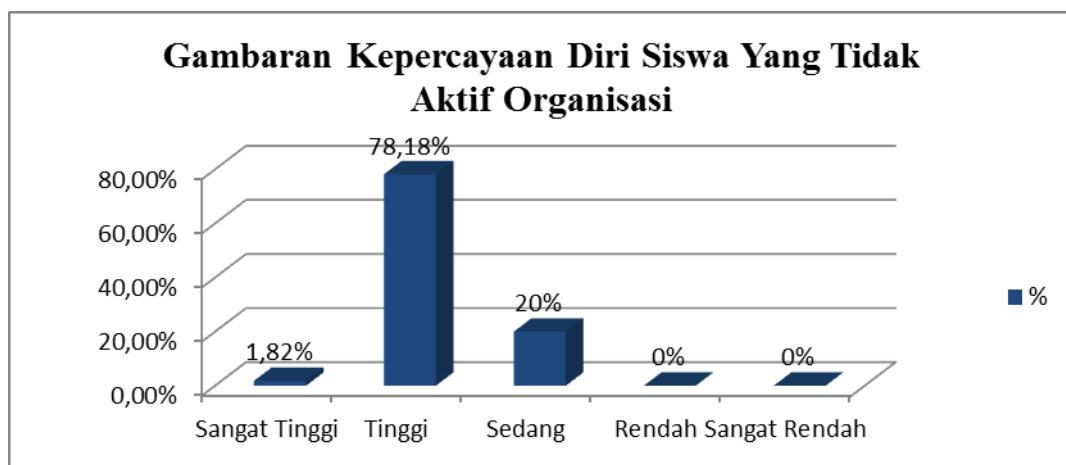
Gambar 2. Gambaran Tingkat Kepercayaan Diri Siswa Yang Tidak Aktif Organisasi.

Berdasarkan data tabel 2 maka dapat disimpulkan bahwa gambaran kepercayaan diri siswa yang tidak aktif organisasi sebagian besar pada katagori tinggi yaitu 78,18%, katagori sangat tinggi 1,82%, dan pada katagori sedang 20%. Sedangkan pada katagori rendah dan sangat rendah tidak ada atau 0%. Untuk dapat lebih jelas, dapat dilihat pada gambar 2.