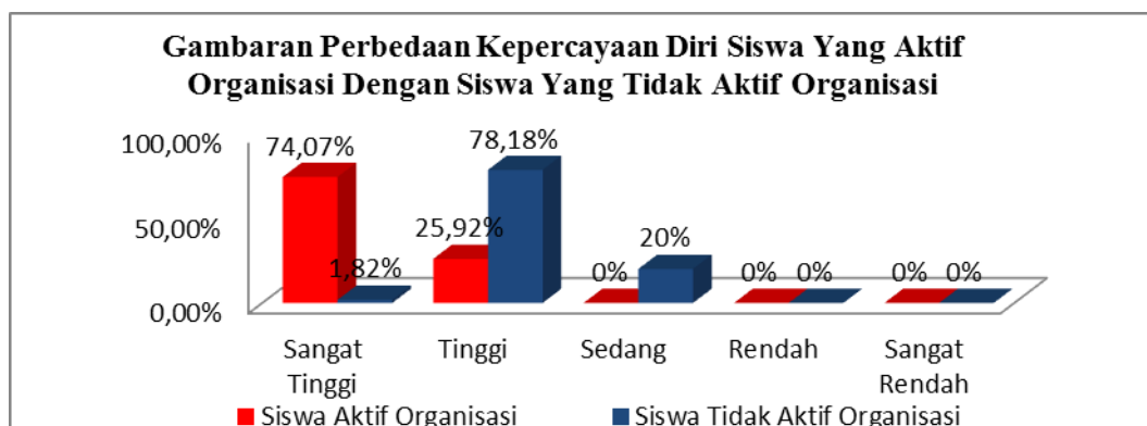
Gambar 3 Gambaran Perbedaan Kepercayaan Diri Siswa Yang Aktif Organisasi Dengan Siswa Yang Tidak Aktif Organisasi

Berdasarkan tabel tersebut, maka dapat disimpulkan bahwa gambaran kepercayaan diri siswa yang aktif organisasi sebagian besar berada pada katagori sangat tinggi 74,07%. Sedangkan kepercayaan diri siswa yang tidak aktif organisasi sebagian besar berada pada katagori tinggi 78,18%. Untuk lebih jelas dapat di lihat pada gambar berikut :