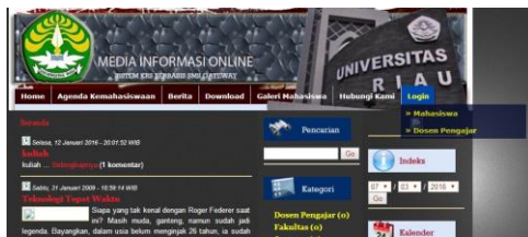
Gambar 3.1.1 Homepage