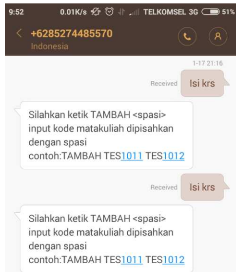
Gambar 3.2.1 Tes sms krs

Pada bahasan ini akan dilihat berhasil atau tidak nya sistem yang telah dibangun. Dengan melakukan percobaan pengisian krs oleh mahasiswa, dapat memastikan kinerja dari sistem yang telah dibangun. Dapat dilihat pada gambar