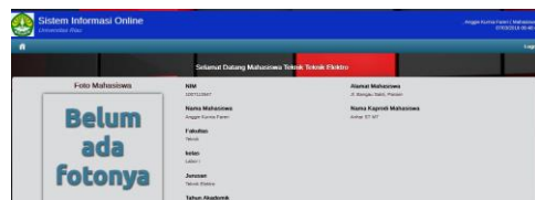
Gambar 3.2.2 Homepage Mahasiswa