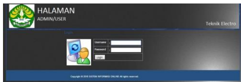
Gambar 3.1.2 Login Dosen