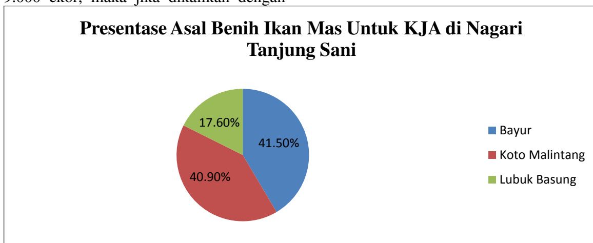
Gambar 2. Presentase Asal Benih Ikan Mas Untuk KJA di Nagari Tanjung Sani.

jumlah KJA di Nagari Tanjung Sani dan jumlah produksi setahun maka seharusnya benih yang disuplai untuk KJA di Nagari Tanjung Sani dalam setahun adalah sebanyak 24.732.000 ekor benih ikan Mas, dan dilihat dari jumlah benih yang disuplai oleh pembenih dan penyuplai benih dalam setahun mereka menyuplai sebanyak 22.518.000 ekor benih ikan Mas. Terdapat selisih kekurangan sebesar 2.214.000 ekor benih ikan Mas, mengingat benih yang disuplai berdasarkan pesanan dari pembudidaya atau dengan kata lain benih datang karena KJA masih aktif atau usaha masih berjalan. Jadi dengan adanya selisih kekurangan 2.214.000 benih maka diperkirakan ada sekitar 246 petak KJA yang tidak aktif lagi dan ini jauh lebih sedikit dibandingkan dengan selisih benih ikan Nila.