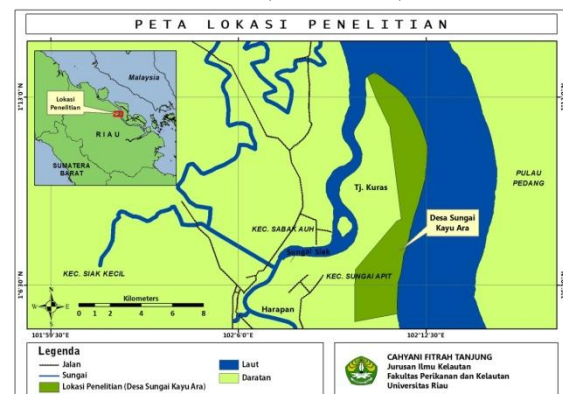
Gambar 1. Peta Lokasi Stasiun Penelitian

Perikanan dan Kelautan Universitas Riau. Pengambilan sampel air laut dilakukan pada perairan Desa Kayu Ara, Kabupaten Siak, Provinsi Riau (Gambar 1).